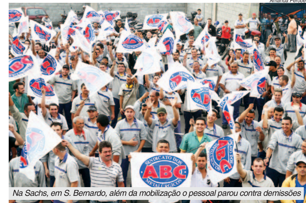
Na Sachs, em S. Bernardo, além da mobilização o pessoal parou contra demissões