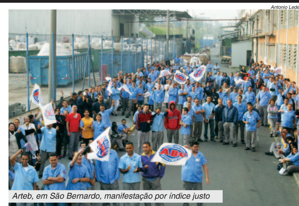
Artes, em São Bernardo, manifestação por índice justo