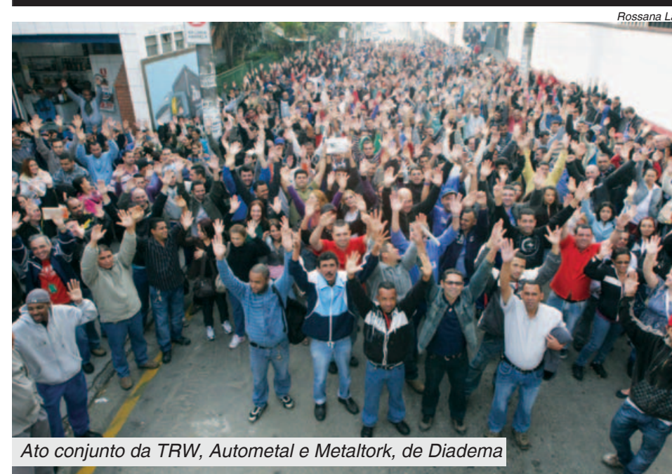
Ato conjunto da TRW, Autometal e Metaltork, de Diadema