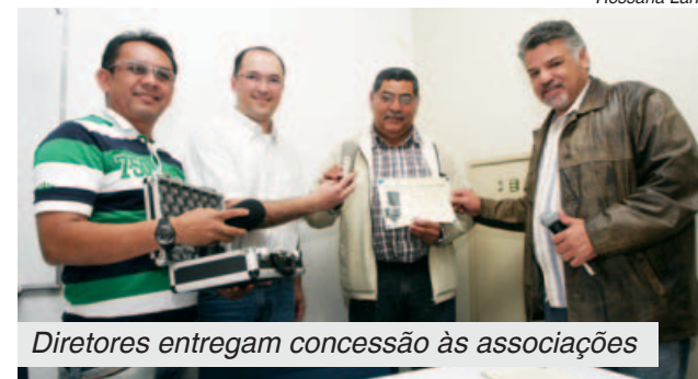
Diretores entregam concessão às associações

No acumulado do ano houve incremento de 5,2%, com 341,3 mil veículos vendidos ao exterior.