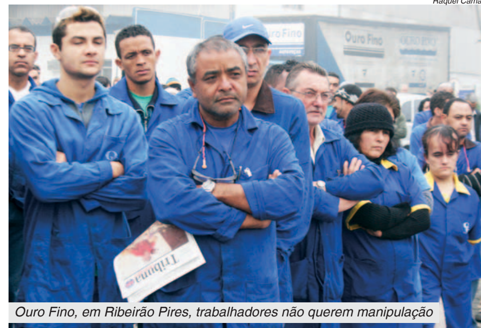
Ouro Fino, em Ribeirão Pires, trabalhadores não querem manipulação