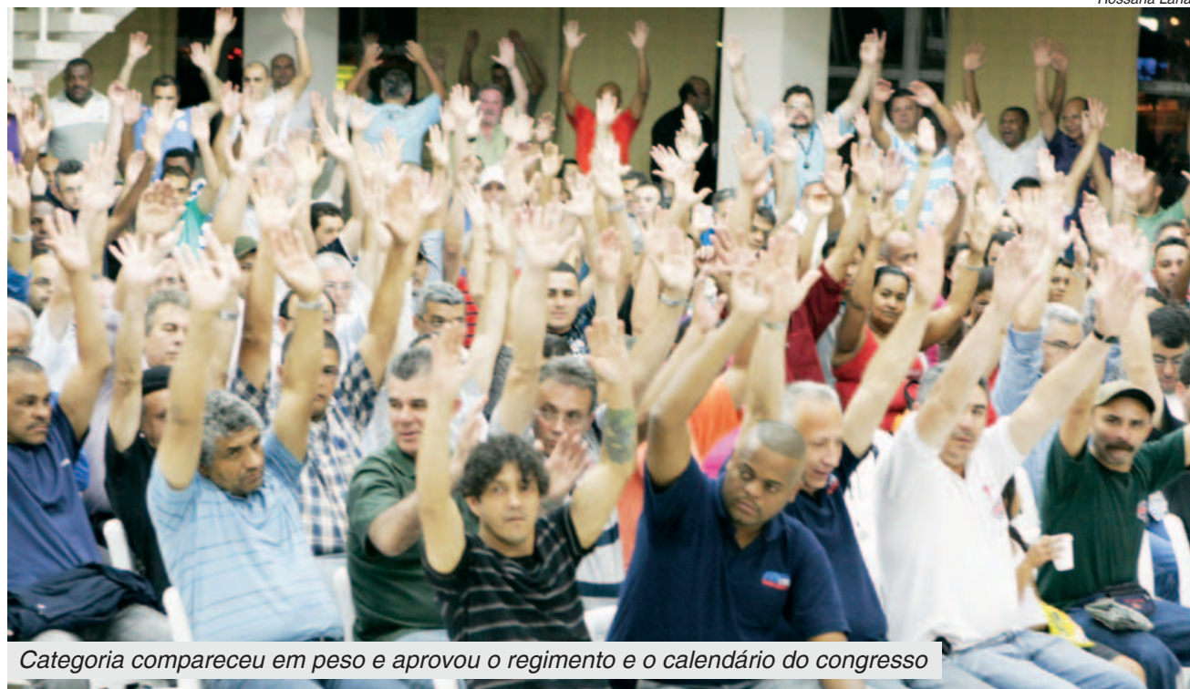
Categoria compareceu em peso e aprovou o regimento e o calendário do congresso

A seguir eles escolherão as plenárias temáticas que desejam participar.