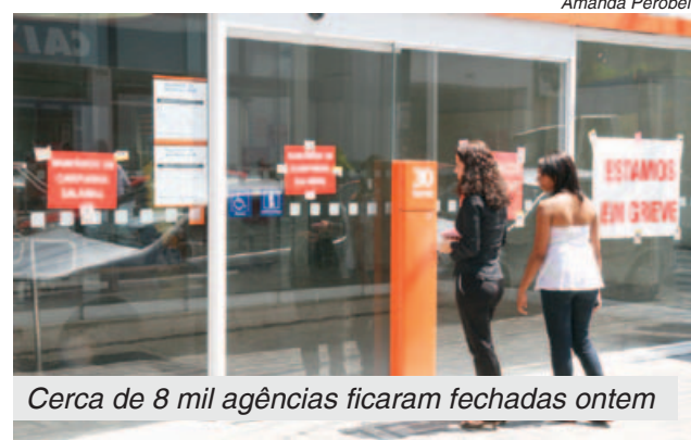
Cerca de 8 mil agências ficaram fechadas ontem

Já os trabalhadores nos Correios decidiram ontem continuar