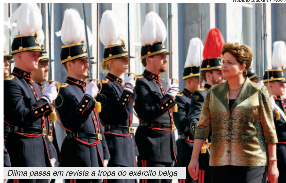
Dilma passa em revista a tropa do exército belga

A aprovação da presidenta também cresceu, passando de 67% em julho para 71% em setembro.