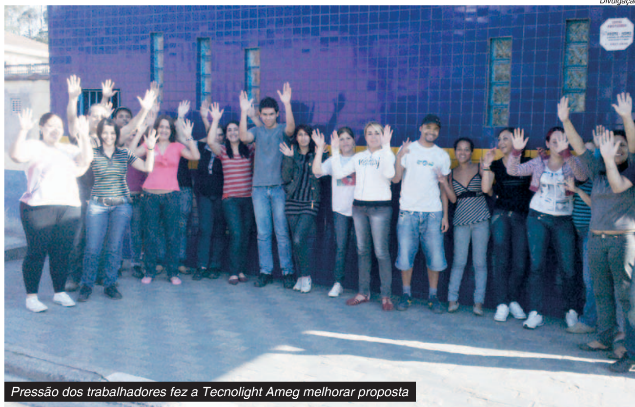
Pressão dos trabalhadores fez a Tecnolight Ameg melhorar proposta

Metalúrgicos em cinco fábricas da base - quatro em Ribeirão Pires e uma em São Bernardo - fecharam acordos de PLR.