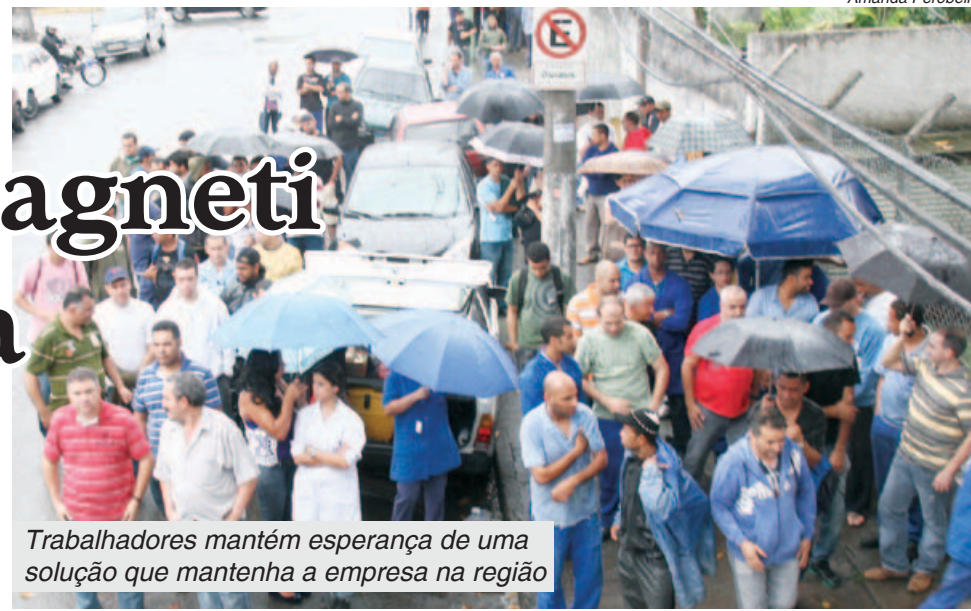
Trabalhadores mantêm esperança de uma solução que mantenha a empresa na região

porém, o País estava em crise e lutávamos contra um governo que não dialogava e não protegia a indústria”, destacou o dirigente.