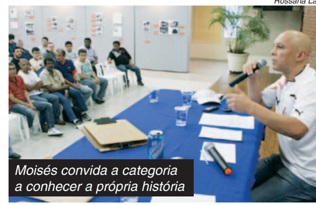
Moisés convida a categoria a conhecer a própria história

"Fiquei emocionado quando cheguei, porque foi a coisa mais