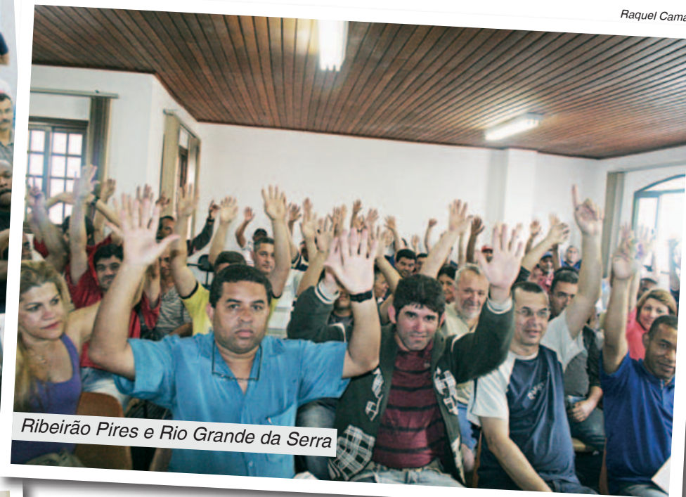
Ribeirão Pires e Rio Grande da Serra