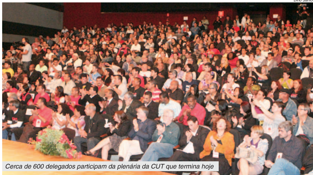
Cerca de 600 delegados participam da plenária da CUT que termina hoje