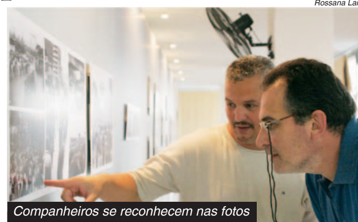
Companheiros se reconhecem nas fotos

A mostra Meio Século de Conquistas, com a história fotográfica do Sindicato, poderá ser vista até dia 7 de novembro, de segunda a sexta, das 9h às 19h, no 3º andar da Sede.