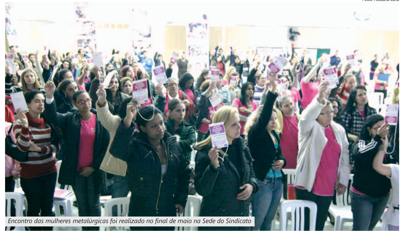
Encontro das mulheres metalúrgicas foi realizado no final de maio na Sede do Sindicato