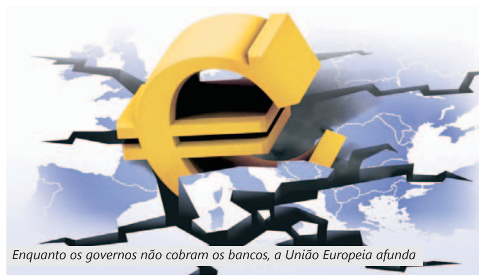
Enquanto os governos não cobram os bancos, a União Europeia afunda

No Brasil, a paralisação de 28 dias nos Correios terminou após julgamento no TST (Tribunal Superior do Trabalho) na última terça-feira.