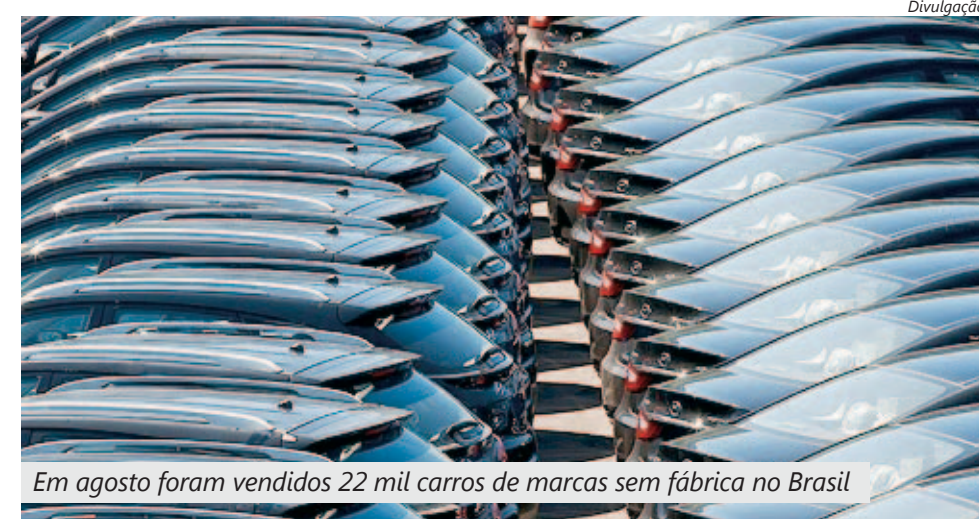
Em agosto foram vendidos 22 mil carros de marcas sem fábrica no Brasil

Também pagará a taxa quem não atenderem requisitos como investimentos em tecnologia e um percentual de 65% de conteúdo nacional.