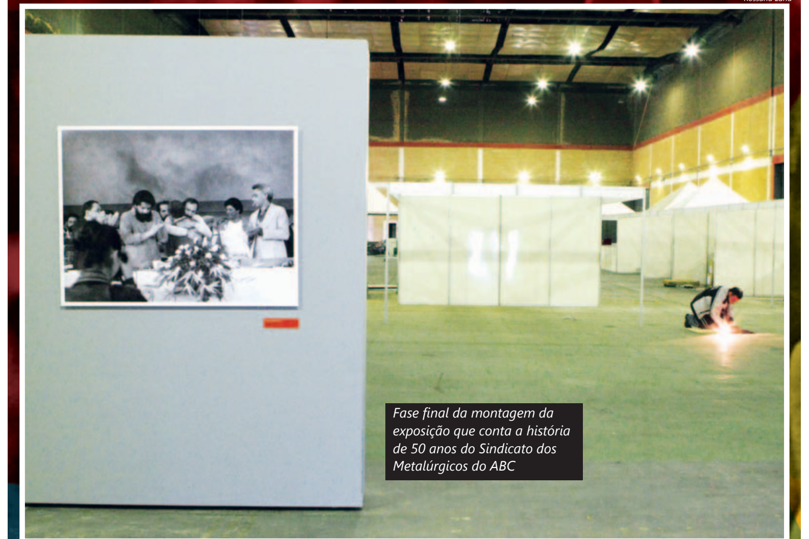
Fase final da montagem da exposição que conta a história de 50 anos do Sindicato dos Metalúrgicos do ABC

Encontro que será aberto hoje, às 18h, no Pavilhão Vera Cruz, em São Bernardo, terá a participação dos ministros Alexandre Padilha (Saúde), Fernando Haddad (Educação), Marco Aurélio Garcia (Assuntos Internacionais) e Fernando Pimentel (Desenvolvimento da Indústria e Comércio Exterior).