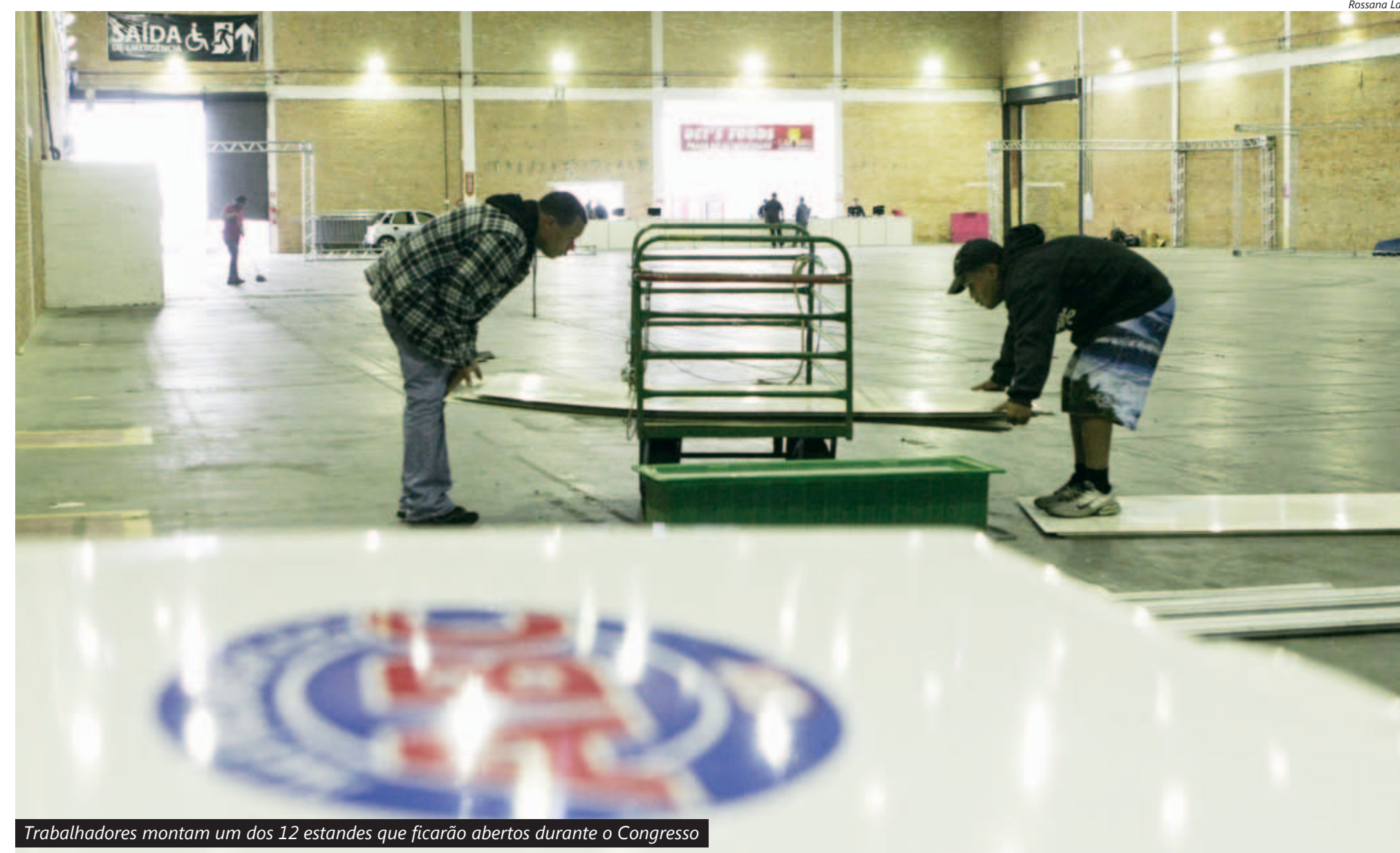
Trabalhadores montam um dos 12 estandes que ficarão abertos durante o Congresso

Entre as personalidades que estarão no 7º Congresso estão os ministros Alexandre Padilha (Saúde), Marco Aurélio Garcia (Assuntos Internacionais), Fernando Haddad (Educação) e Fernando Pimentel (Desenvolvimento, Indústria e Comércio Exterior).