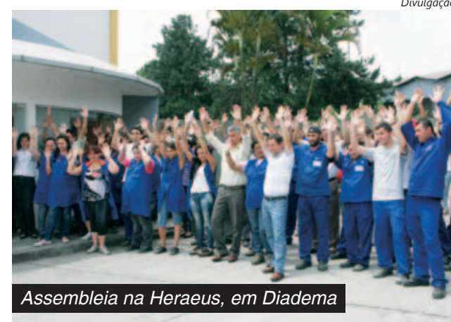
Assembleia na Heraeus, em Diadema

Na quarta da semana passada o pessoal na SWB Indústria Metalúrgica, em Ribeirão Pires, conquistou