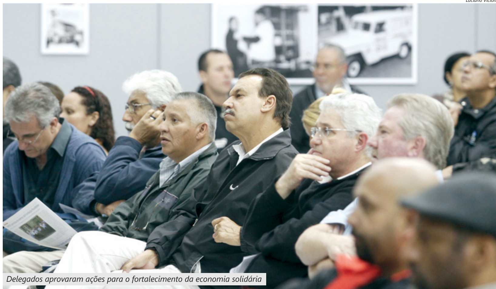
Delegados aprovaram ações para o fortalecimento da economia solidária