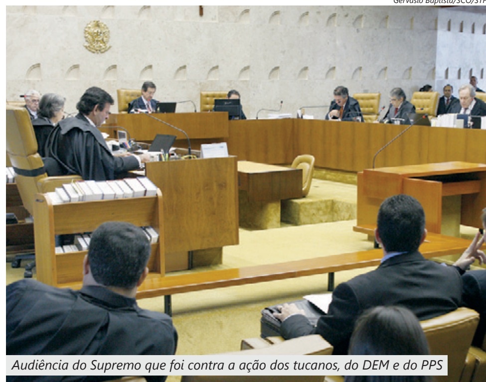
Audiência do Supremo que foi contra a ação dos tucanos, do DEM e do PPS

cando os percentuais fixados pelo Legislativo. "Tal decreto não inova a ordem jurídica, tão somente aplica a lei tal como ditado para cada período", concluiu a decisão.