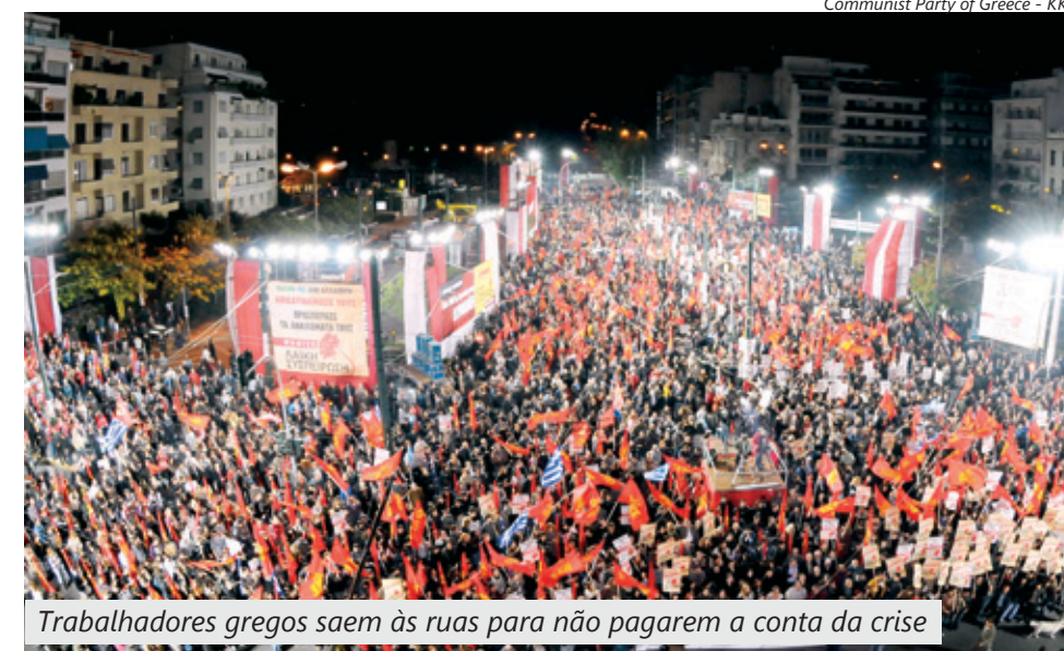
Trabalhadores gregos saem às ruas para não pagarem a conta da crise

Neste ano, a crise derrubou os governos na Irlanda e em Portugal, e coloca em risco o cargo do primeiro ministro espanhol José Juiz Zapatero nas eleições que vão acontecer na próxima semana.