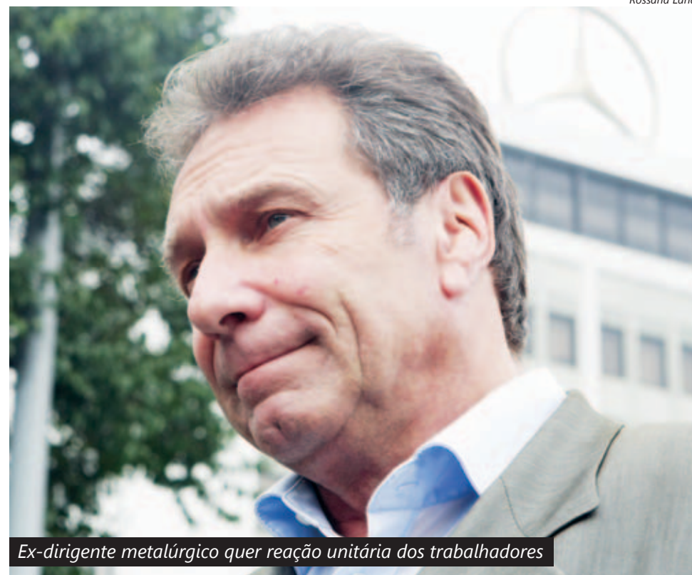
Ex-dirigente metalúrgico quer reação unitária dos trabalhadores

“Os trabalhadores precisam reagir”, afirmou. “Vemos greves em diversos países da Europa como Portugal, Grécia, Itália e Reino Unido. Eles são quem mais sofrem com as medidas de austeridade, por isso devem se defender”, destacou.