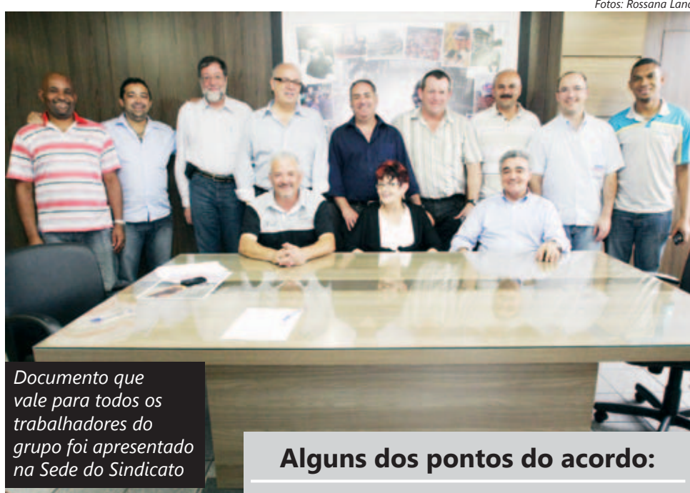
Documento que vale para todos os trabalhadores do grupo foi apresentado na Sede do Sindicato

Uma comitiva de metalúrgicos alemães da ZF Sachs esteve no Sindicato no final de novembro para apresentar o Acordo Marco Internacional, novo código de conduta que vai reger as relações entre trabalhadores e empresa nas fábricas do grupo em todo o mundo. O documento vale