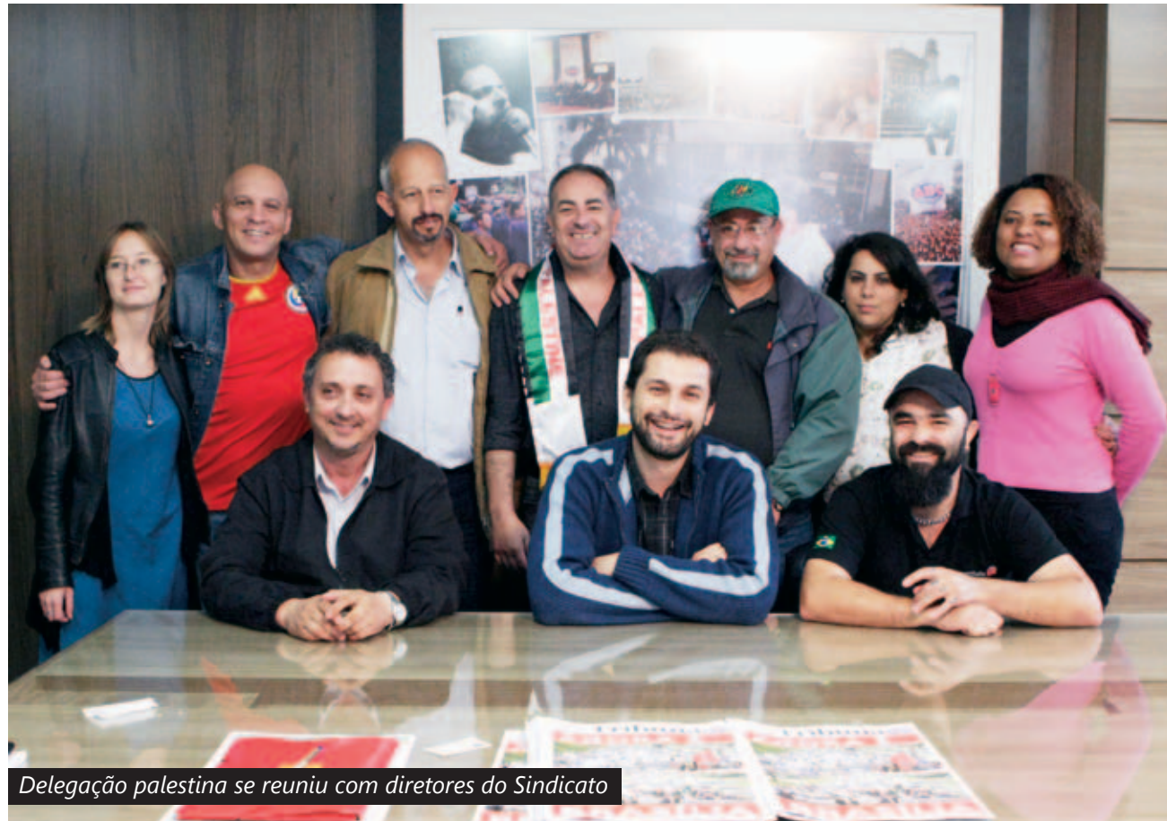
Delegação palestina se reuniu com diretores do Sindicato