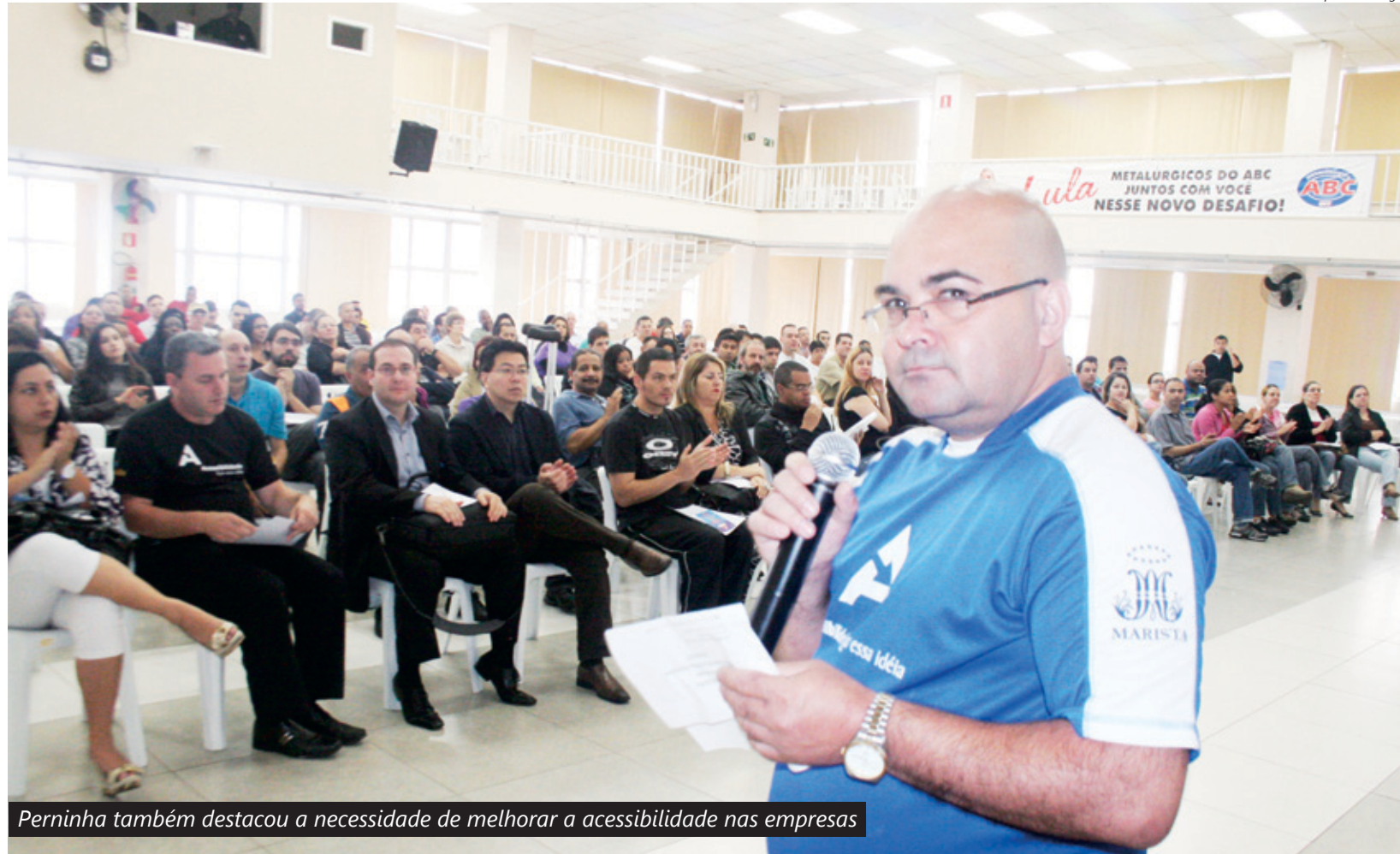
Perninha também destacou a necessidade de melhorar a acessibilidade nas empresas