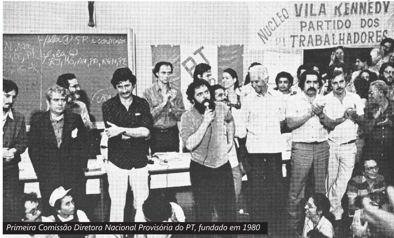
Primeira Comissão Diretora Nacional Provisória do PT, fundado em 1980

O 9º Congresso Estadual dos Metalúrgicos de São Paulo, realizado na cidade de Lins entre 22 e 26 de janeiro de 1979, mostrou a insatisfação da categoria às mordanças impostas pela ditadura num momento em que o País caminhava rumo à democracia.