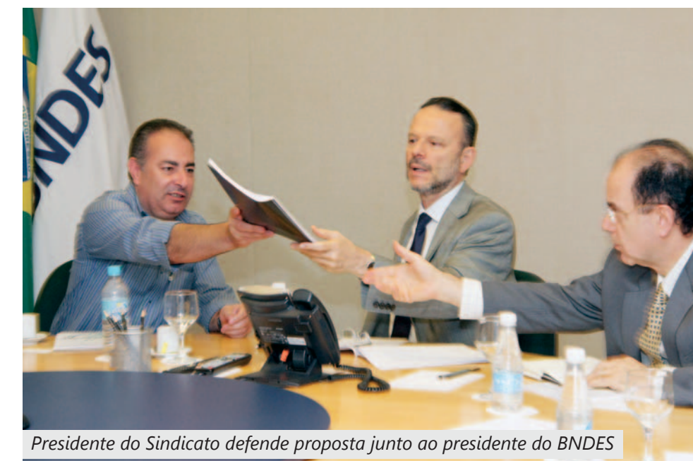
Presidente do Sindicato defende proposta junto ao presidente do BNDES

Para atingir seus objetivos, o Sindicato tem consciência que é necessário envolver o governo federal no projeto.