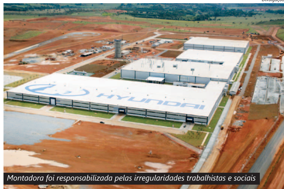
Montadora foi responsabilizada pelas irregularidades trabalhistas e sociais

“Como a Hyundai alegava não ter condições de fiscalizar as terceirizadas, optamos pela interdição dos alojamentos até fechar o acordo que determina aos trabalhadores das terceiras o mesmo tratamento do pessoal da