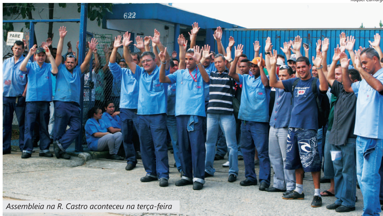
Assembleia na R. Castro aconteceu na terça-feira