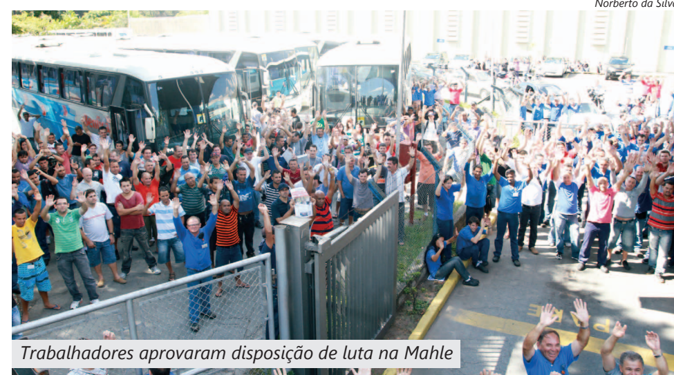
Trabalhadores aprovaram disposição de luta na Mahle