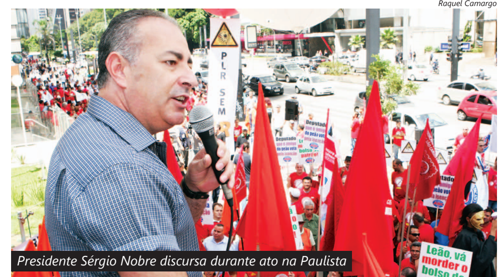
Presidente Sérgio Nobre discursa durante ato na Paulista