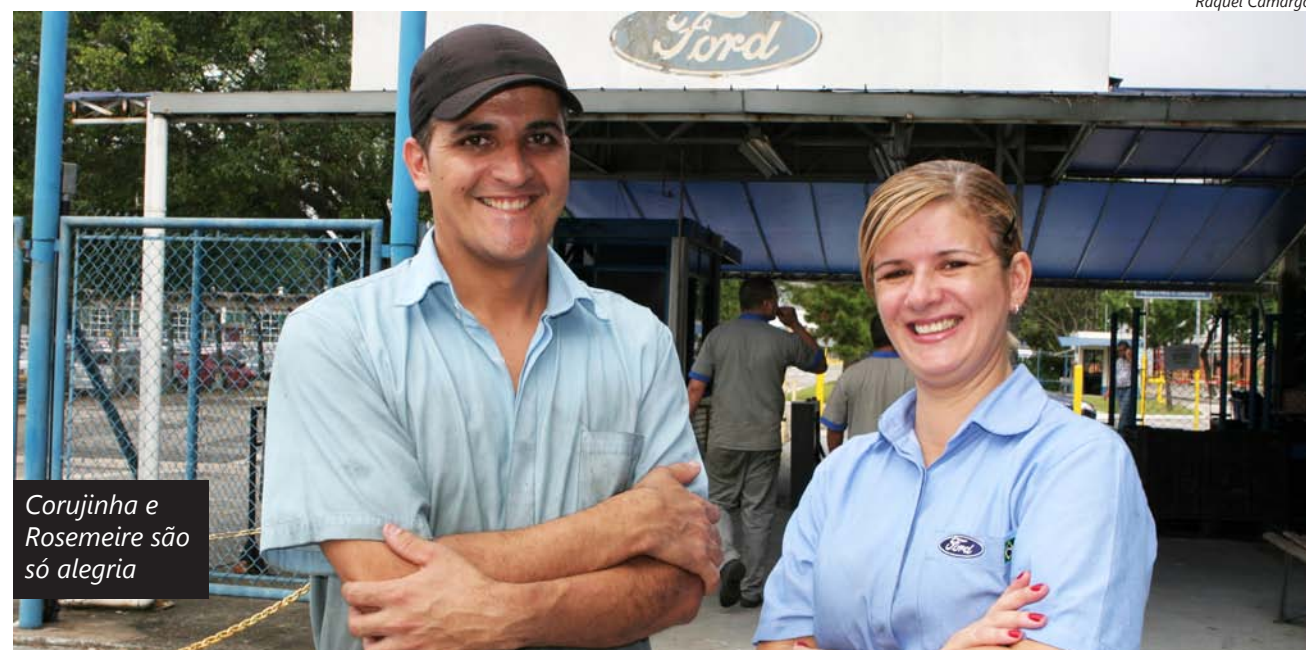
Corujinha e Rosemeire são só alegria

Sessenta e dois metalúrgicos foram efetivados na Ford após cumprirem 18 meses de contrato temporário.