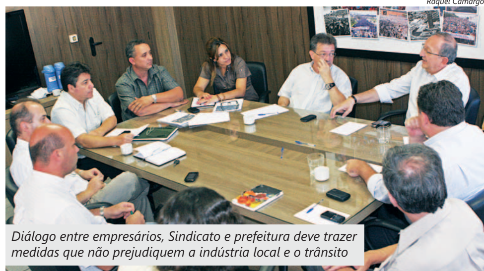
Diálogo entre empresários, Sindicato e prefeitura deve trazer medidas que não prejudiquem a indústria local e o trânsito

Ela recebeu críticas dos empresários, que alegam aumento de custos com sua ins-