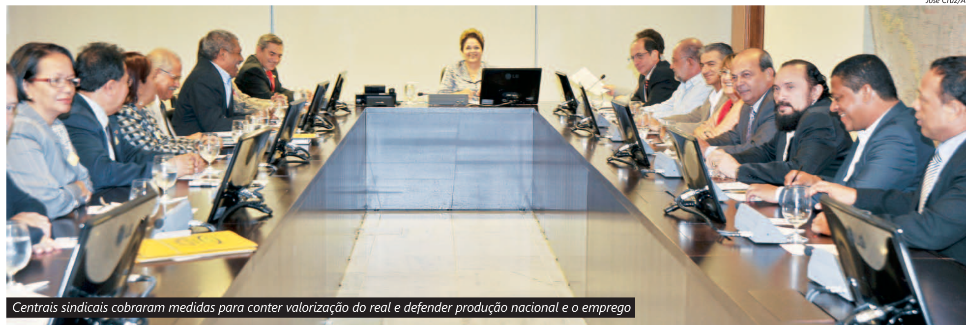
Centrais sindicais cobraram medidas para conter valorização do real e defender produção nacional e o emprego

Em reunião com as seis maiores centrais sindicais brasileiras ontem, em Brasília, a presidenta Dilma Rousseff disse que aqueles que apostarem na valorização do real frente ao dólar irão perder e que