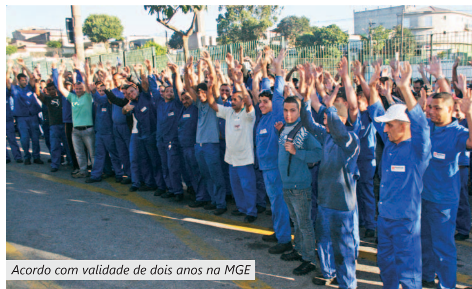
Acordo com validade de dois anos na MGE