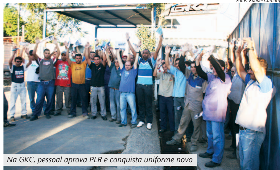
Na GKC, pessoal aprova PLR e conquista uniforme novo