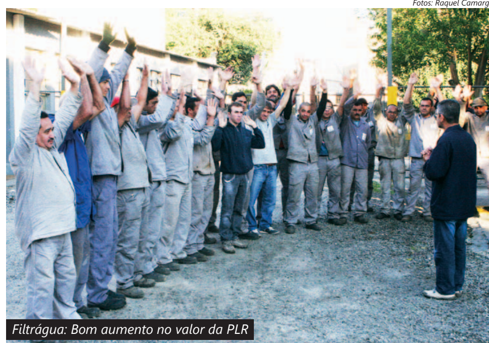
Filtrágua: Bom aumento no valor da PLR