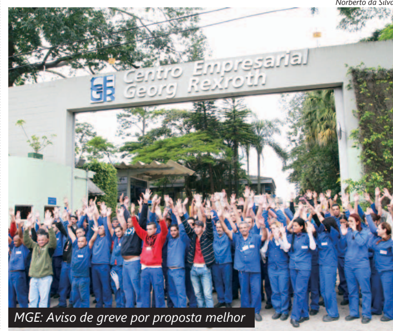
MGE: Aviso de greve por proposta melhor