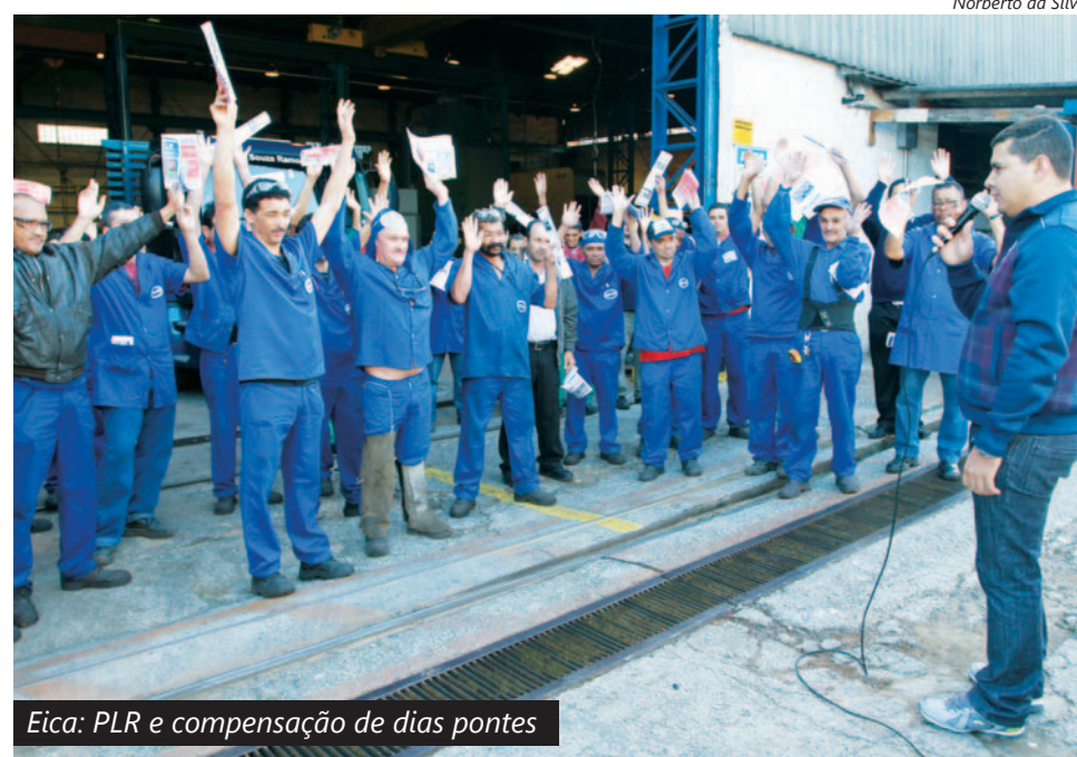
Eica: PLR e compensação de dias pontes