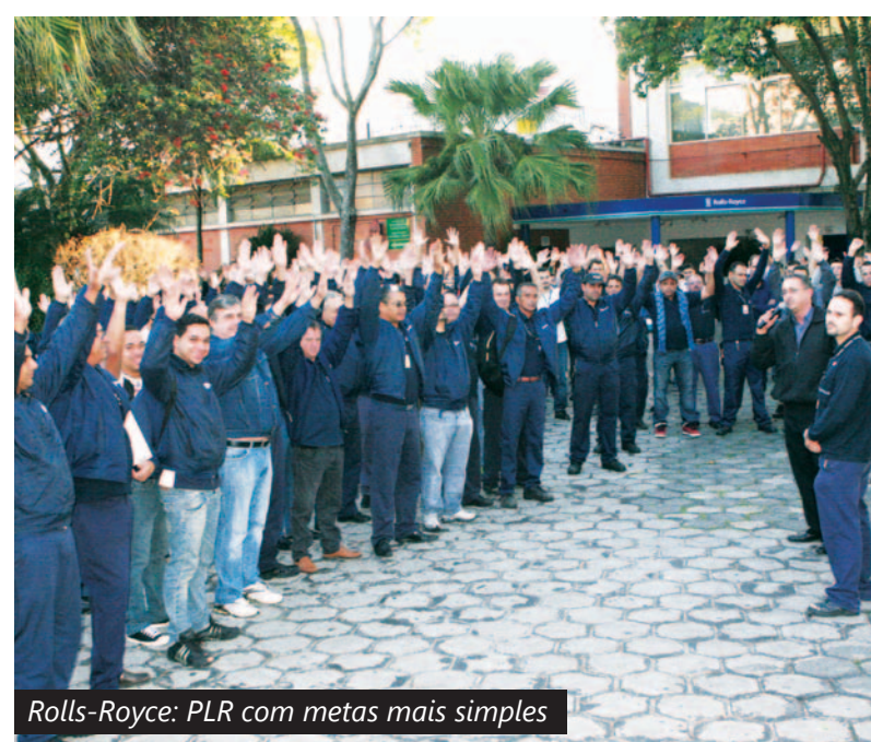
Rolls-Royce: PLR com metas mais simples