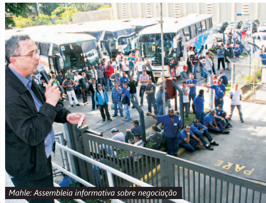
Mahle: Assembleia informativa sobre negociação