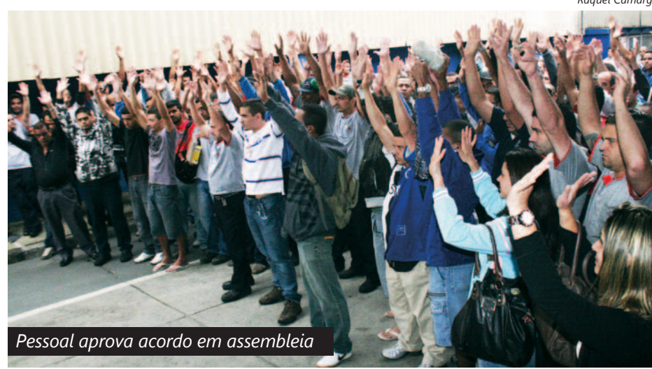
Pessoal aprova acordo em assembleia