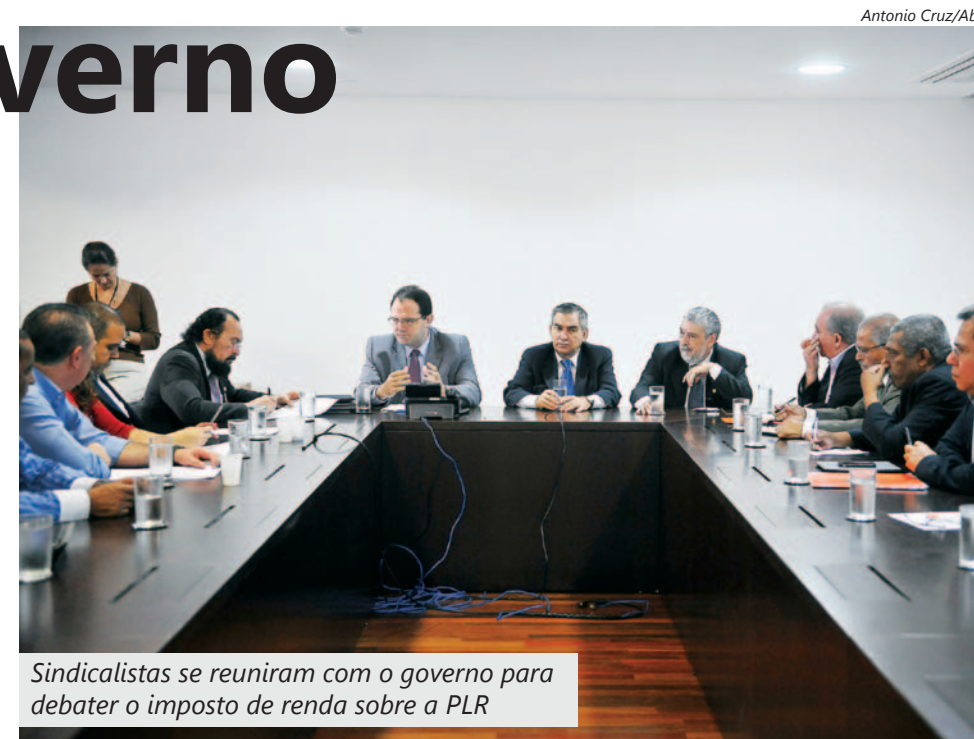
Sindicalistas se reuniram com o governo para debater o imposto de renda sobre a PLR

Os sindicalistas entregaram uma contraproposta de isenção total do imposto para quem recebe até R$ 10 mil de PLR. A partir desse valor, a isenção seria escalonada. Uma nova reunião foi marcada para o próximo dia 11, em Brasília para voltar a debater o assunto.