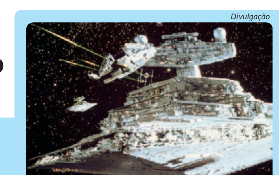
Tem exposição Star Wars em São Caetano