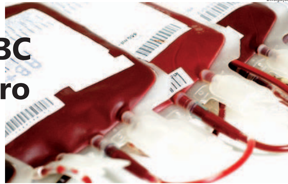
Divulgação Doador e seria muito bom se conseguíssemos comemorar a data com

As reservas de sangue nos hemocentros do ABC estão com os dias contados.