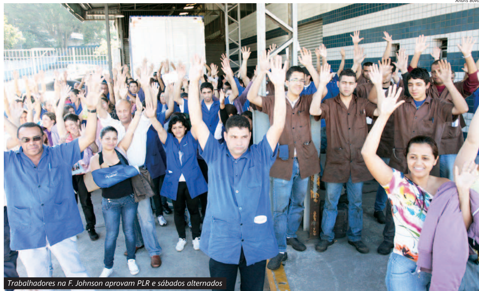
Trabalhadores na F. Johnson aprovam PLR e sábados alternados

O metalúrgico na F. Johnson , em Diadema, aprovaram ontem a proposta de participação nos lucros e resultados e o acordo de trabalho em sábados alternados. A partir de 21 de agosto, os trabalhadores terão direito às folgas alternadas.