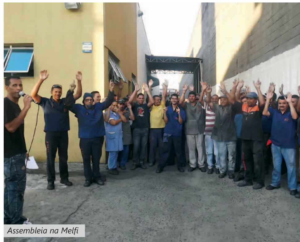
Assembleia na Melfi