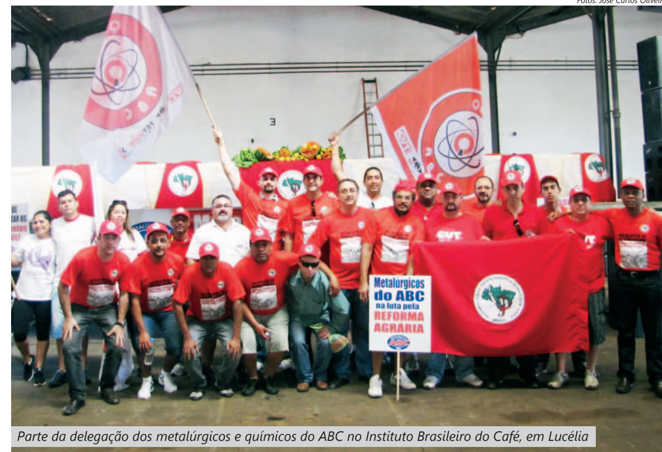
Parte da delegação dos metalúrgicos e químicos do ABC no Instituto Brasileiro do Café, em Lucélia

A proibição de um promotor de Justiça não impediu que cerca de 4 mil trabalhadores do campo e da cidade - entre eles uma delegação de metalúrgicos do ABC - lotassem na manhã do último sábado o pátio do antigo Instituto Brasileiro do Café, em Lucélia, região do Oeste Paulista, para realizar ato que cobrou pressão na Reforma Agrária.