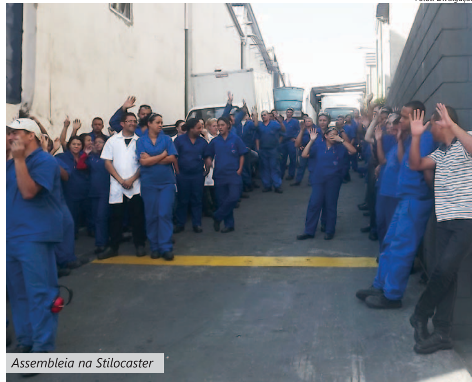
Assembleia na Stilocaster

Após uma série de reuniões, Sindicato e fábrica chegaram a um acordo, que foi aprovado pelos com-