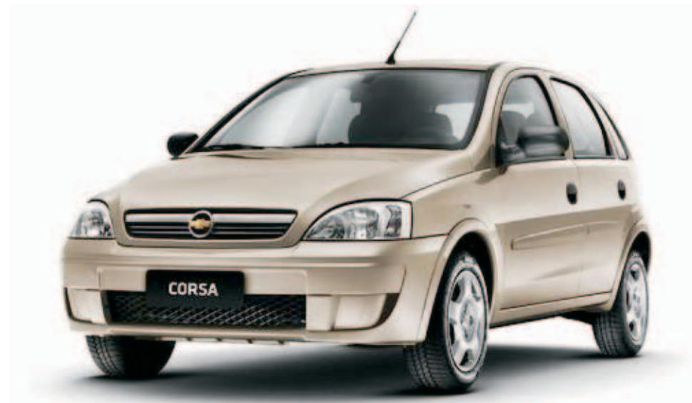
Outras linhas, como a do Corsa, podem ser fechadas

a direção do Sindicato se negou a fazer acordo mesmo com os trabalhadores se manifestando favoráveis ao processo de negociação para evitar a desativação das linhas de produção conhecidas como MVA (Montagem de Veículos Automotores).