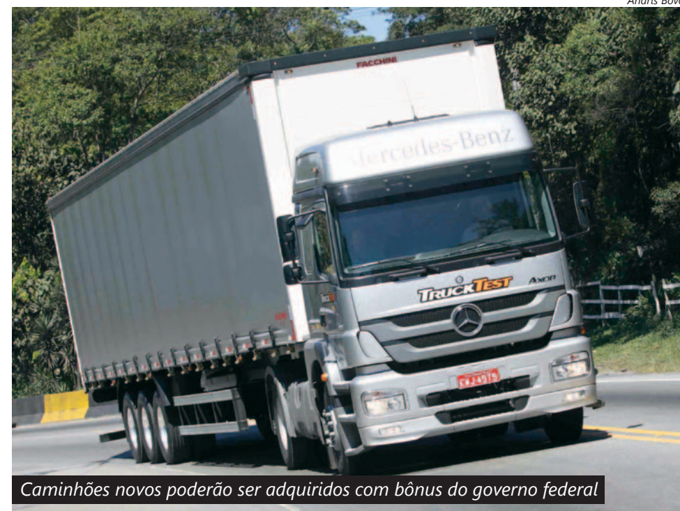
Caminhões novos poderão ser adquiridos com bônus do governo federal

Desde o final do ano passado, as vendas de caminhões novos no País despencaram por causa da mudança na produção dos motores exigida pela norma Proconve-7 (Euro 5).