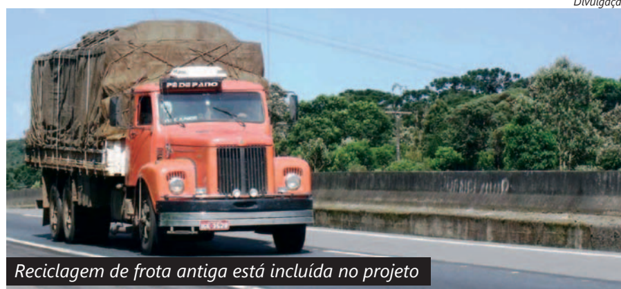
Reciclagem de frota antiga está incluída no projeto

“Além de todas essas vantagens, diminui o custo de frete para o transportador e os caminhões velhos serão reciclados, já que as peças podem ser reaproveitadas”, concluiu o dirigente.