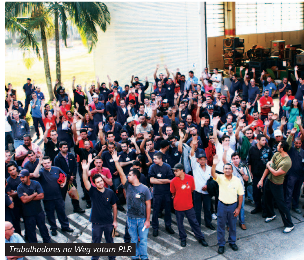
Trabalhadores na Weg votam PLR

sairão em setembro deste ano e março de 2013.