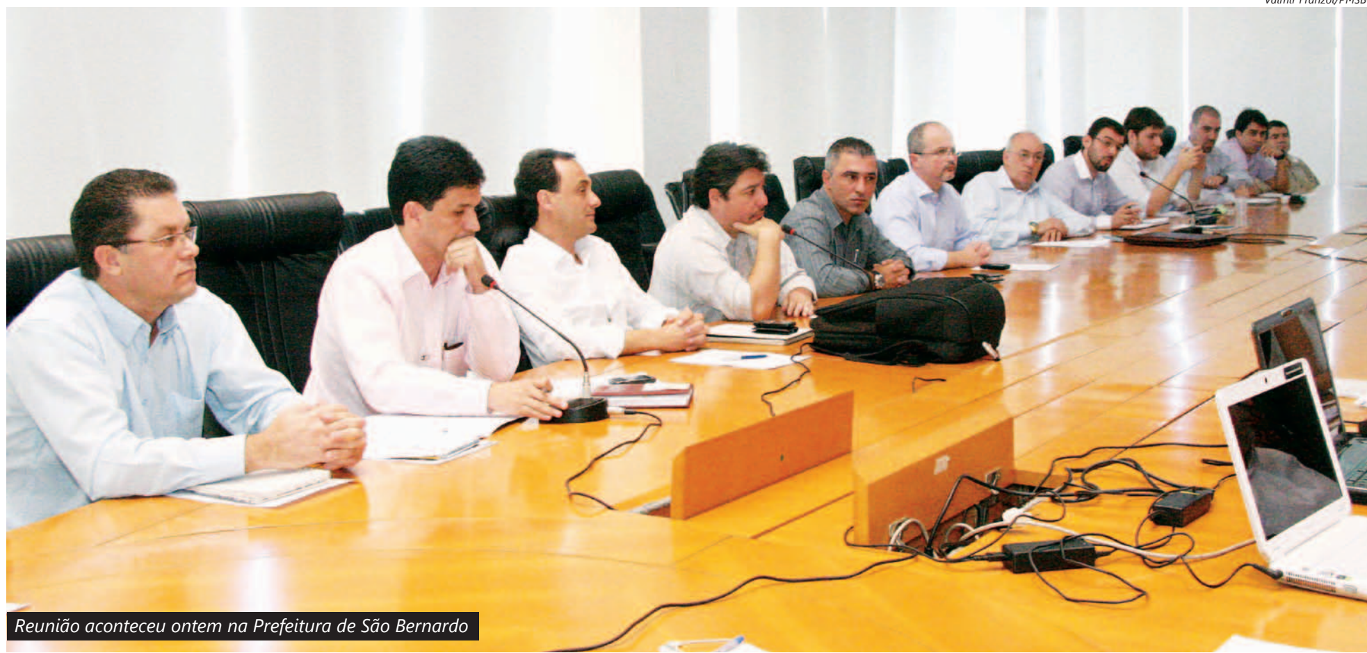
Reunião aconteceu ontem na Prefeitura de São Bernardo