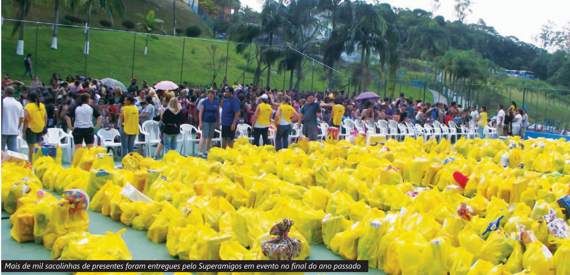
Mais de mil sacolinhas de presentes foram entregues pelo Superamigos em evento no final do ano passado

O trabalho social voluntário feito pelo grupo Superamigos, formado por trabalhadores na Scania e outras empresas da base, completou quinze anos em julho.