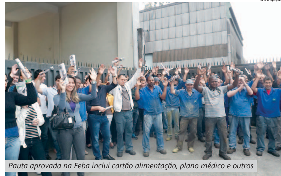
Pauta aprovada na Feba inclui cartão alimentação, plano médico e outros

“Essas conquistas só foram possíveis por causa do empenho e da mobilização dos companheiros na Feba”, destacou Da Lua .