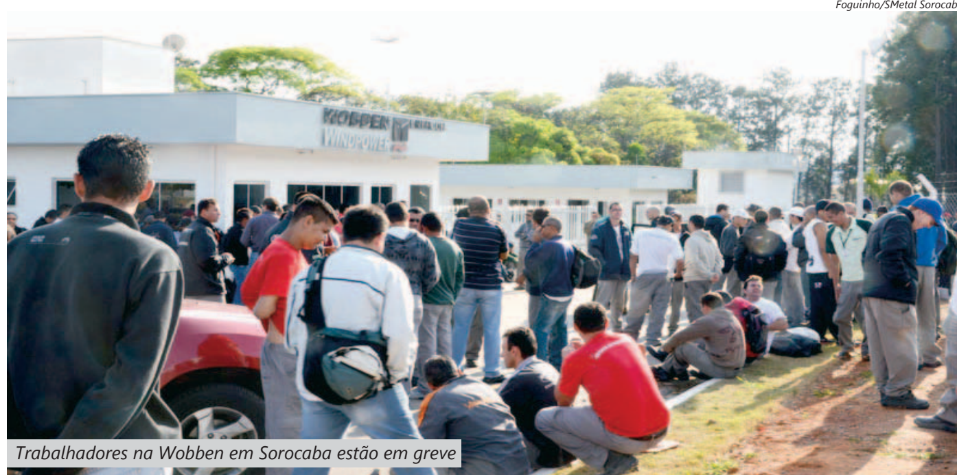
Trabalhadores na Wobben em Sorocaba estão em greve.

Até agora, esses setores ofereceram valores inferiores ao reivindicado, que foram imediatamente rejeitados na mesa de negociações pela FEM-CUT.