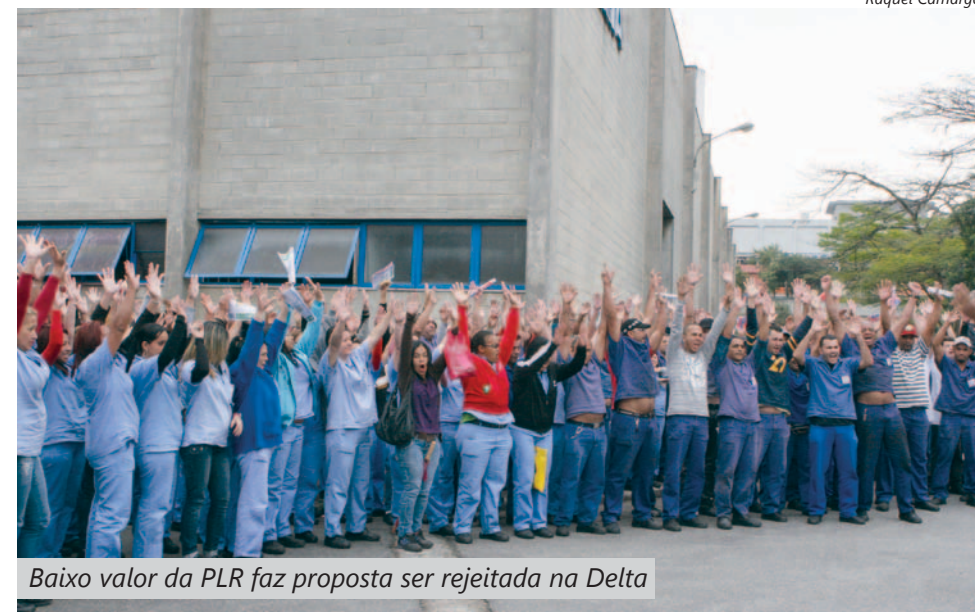
Baixo valor da PLR faz proposta ser rejeitada na Delta

Em janeiro, Sindicato e empresa voltam a discutir a proposta de participação nos lucros e resultados e restaurante dentro da fábrica para os trabalhadores.