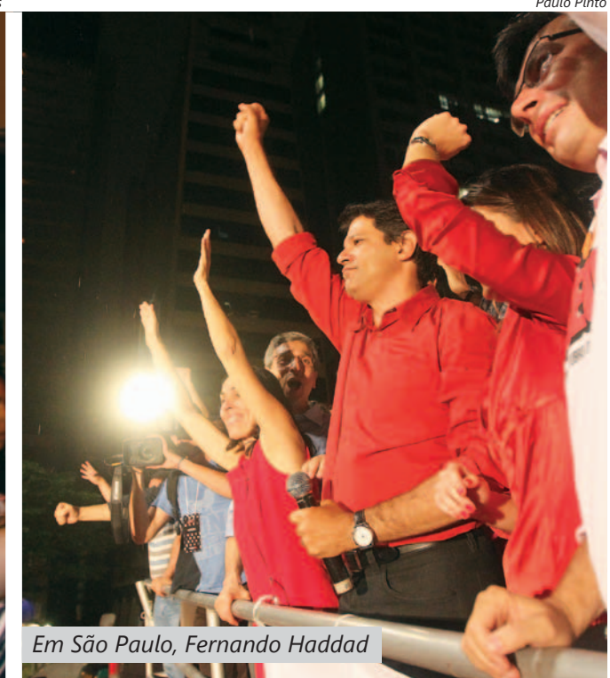
Em São Paulo, Fernando Haddad