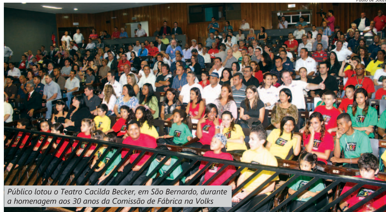
Público lotou o Teatro Cacilda Becker, em São Bernardo, durante a homenagem aos 30 anos da Comissão de Fábrica na Volks

Hoje os companheiros na Volks participarão de ato na fábrica em São Bernardo para comemorar o aniversário da Comissão.