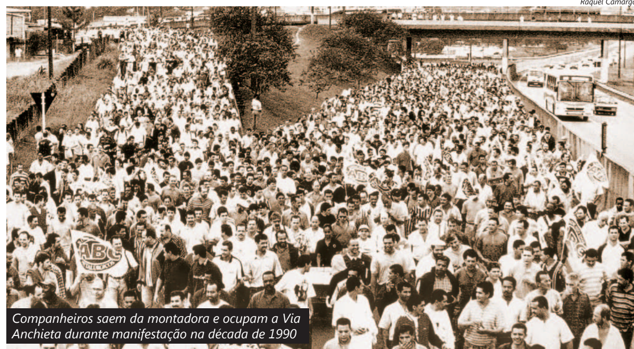
Companheiros saem da montadora e ocupam a Via Anchieta durante manifestação na década de 1990