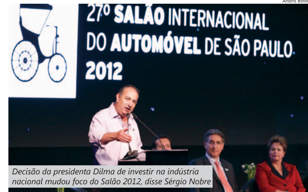
Decisão da presidenta Dilma de investir na indústria nacional mudou foco do Salão 2012, disse Sérgio Nobre

“É importante termos aqui o trabalho criativo, com o desenvolvimento da indústria, da produção nacional e de tecnologia. Temos