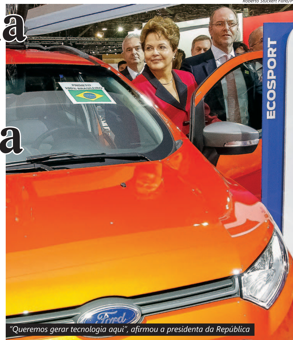
“Queremos gerar tecnologia aqui”, afirmou a presidenta da República

A avaliação da área técnica do governo, é de que o estímulo ao