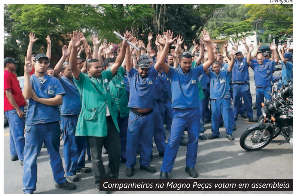
Companheiros na Magno Peças votam em assembleia

Em assembleia conjunta, eles rejeitaram o que foi oferecido pelo patrão e exigiram valores maiores.