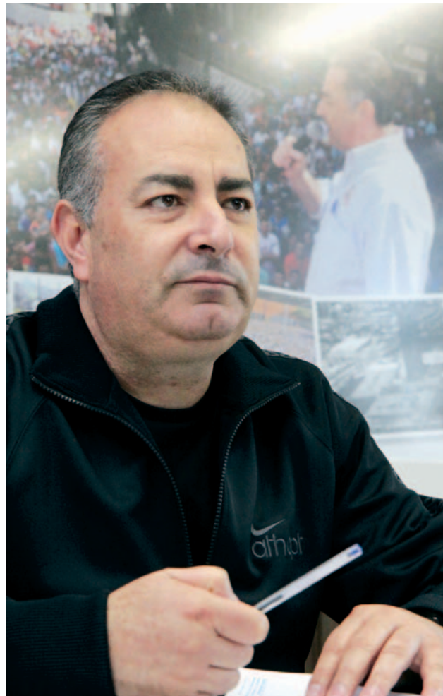
"Queremos a modernização das relações de trabalho, com respeito aos direitos dos trabalhadores"

Recorde Depósitos em caderneta de poupança em outubro superaram os saques em R$ 3,24 bilhões, o maior valor registrado para o mês.