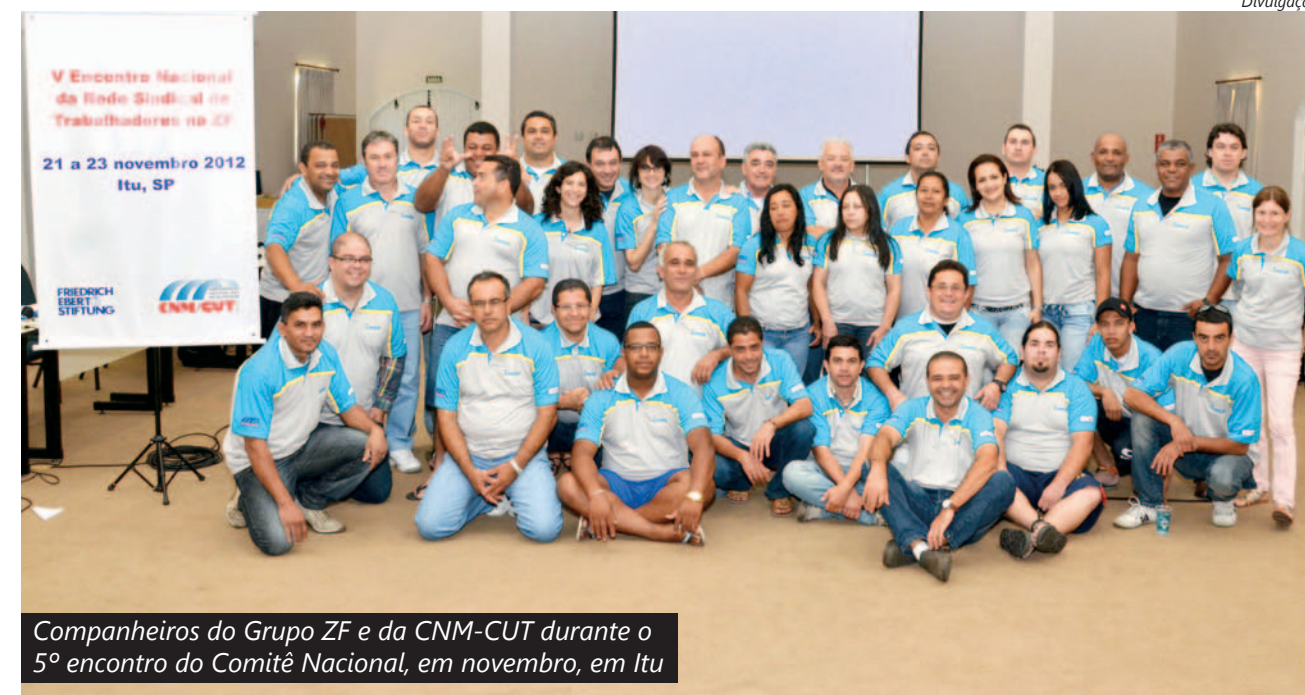
Companheiros do Grupo ZF e da CNM-CUT durante o 5º encontro do Comitê Nacional, em novembro, em Itu

“O bom momento que o Brasil passa atraiu a atenção dos europeus, que respeitam o trabalho