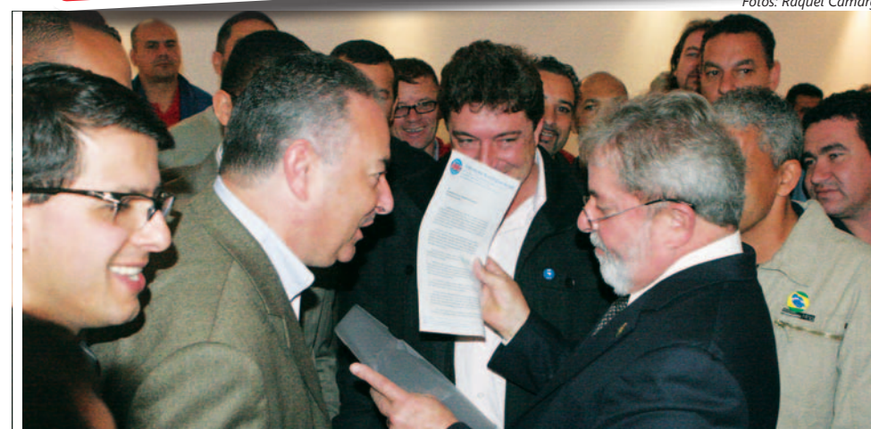
Pauta de reivindicação foi entregue ao ex-presidente Lula em junho de 2010