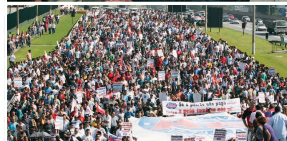
Mais de 20 mil trabalhadores voltaram a ocupar a Anchieta em março de 2012