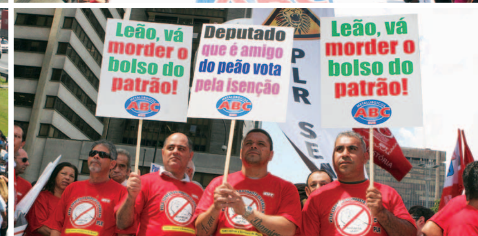
Ato reuniu metalúrgicos, bancários, químicos e petroleiros na Avenida Paulista

Mobilização iniciada pelos Metalúrgicos do ABC garante aos trabalhadores que recebem até R$ 6 mil de PLR não pagarem mais imposto de renda sobre o ganho. A medida beneficia cerca de 70 mil companheiros na base, que embolsarão em torno de R$ 66 milhões antes entregues ao leão.