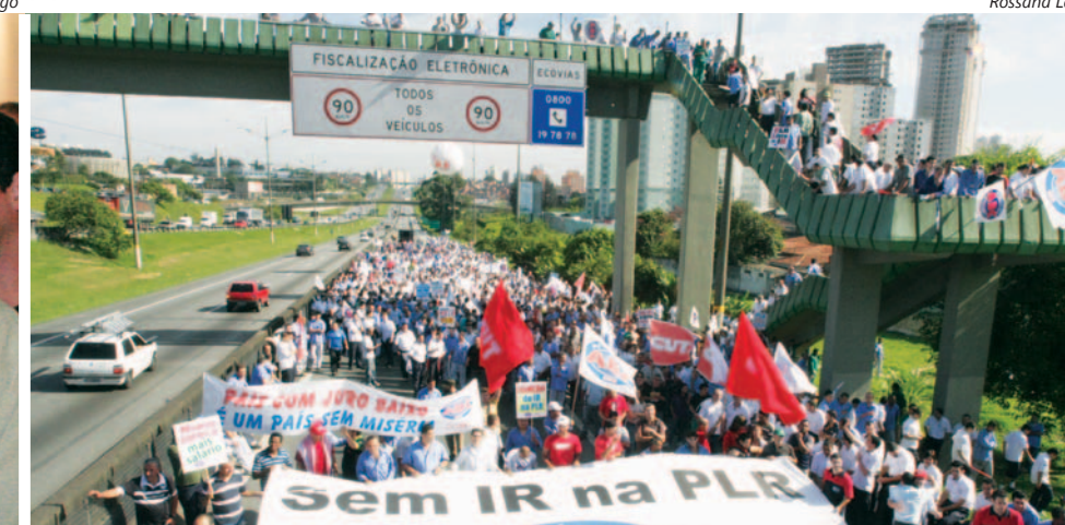
Manifestação na Via Anchieta aconteceu em novembro de 2011