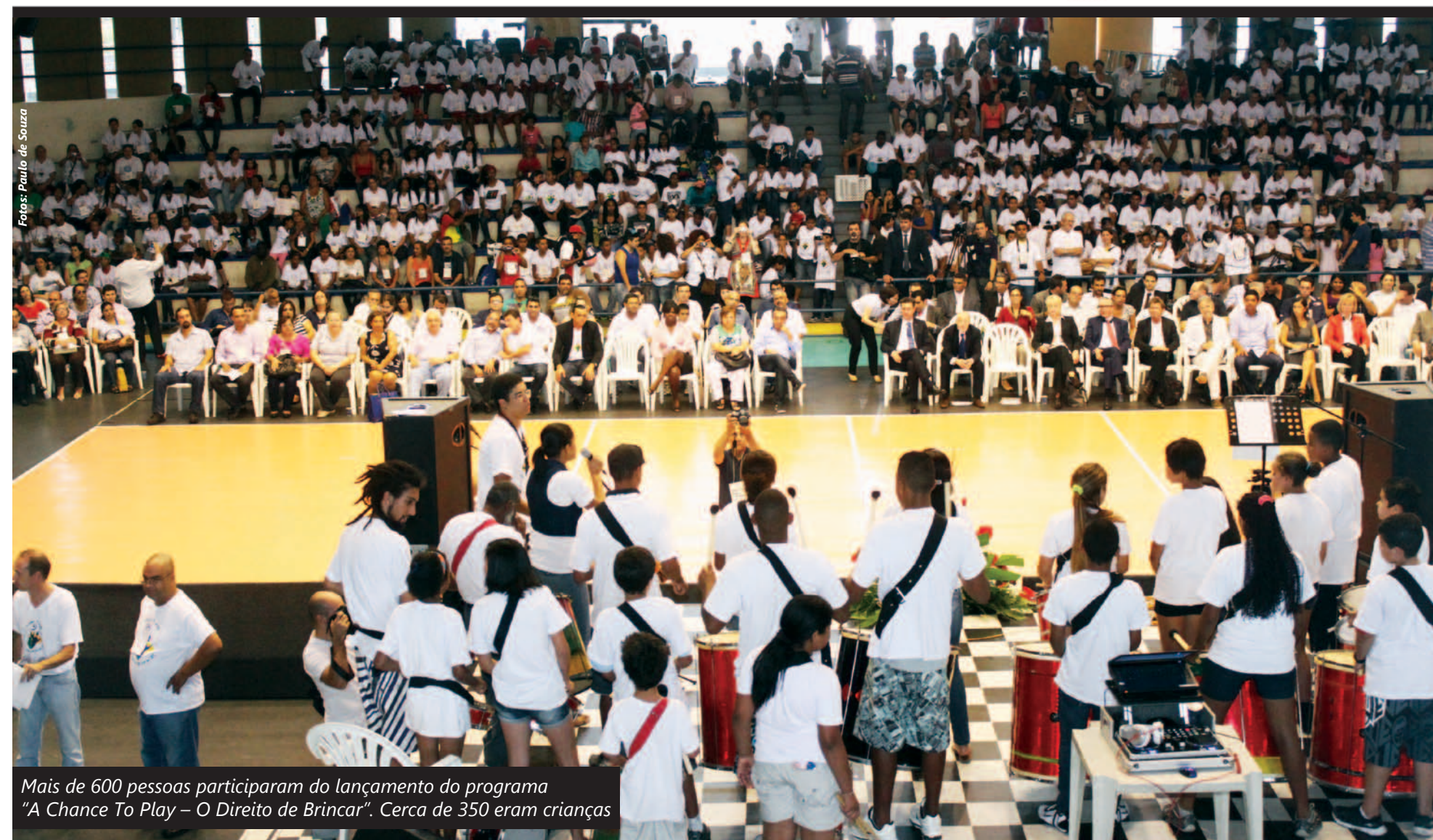
Mais de 600 pessoas participaram do lançamento do programa "A Chance To Play - O Direito de Brincar". Cerca de 350 eram crianças

Sexta-feira 25 de janeiro de 2013 Edição nº 3301