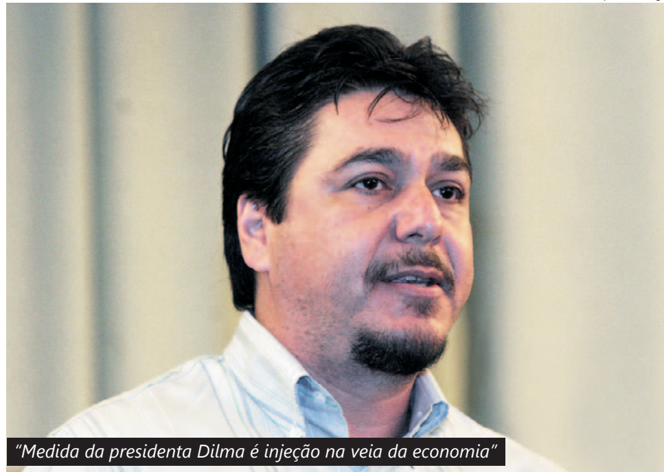
"Medida da presidenta Dilma é injeção na veia da economia"

O presidente do Sindicato, Rafael Marques, declarou ontem que ações como o corte na conta de luz anunciado pela presidenta Dilma Rousseff - que reduzirá o preço da energia em 18% nas residências e em 32% na indústria - são essenciais para desenvolvimento do Brasil.