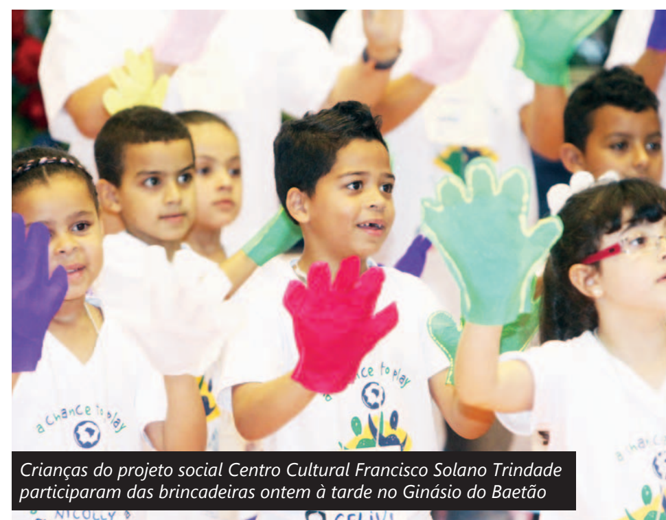
Crianças do projeto social Centro Cultural Francisco Solano Trindade participaram das brincadeiras ontem à tarde no Ginásio do Baetão