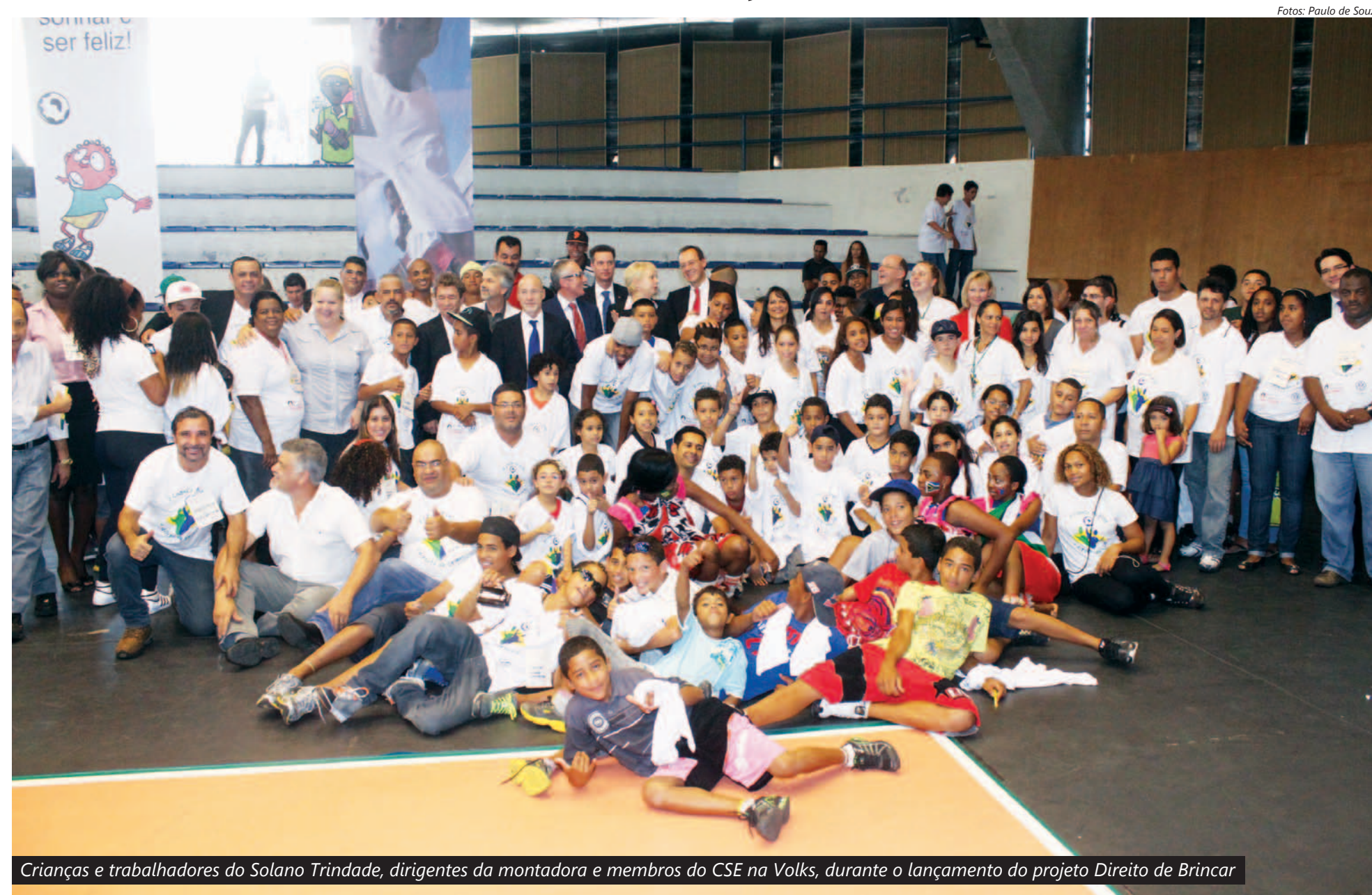
Crianças e trabalhadores do Solano Trindade, dirigentes da montadora e membros do CSE na Volks, durante o lançamento do projeto Direito de Brincar

Com muita música, danças, arte e brincadeiras, mais de 600 pessoas – entre elas 350 crianças e adolescentes – participaram ontem do lançamento mundial do programa "A Chance to Play – O Direito de Brincar", no Ginásio do Baetão, em São Bernardo.