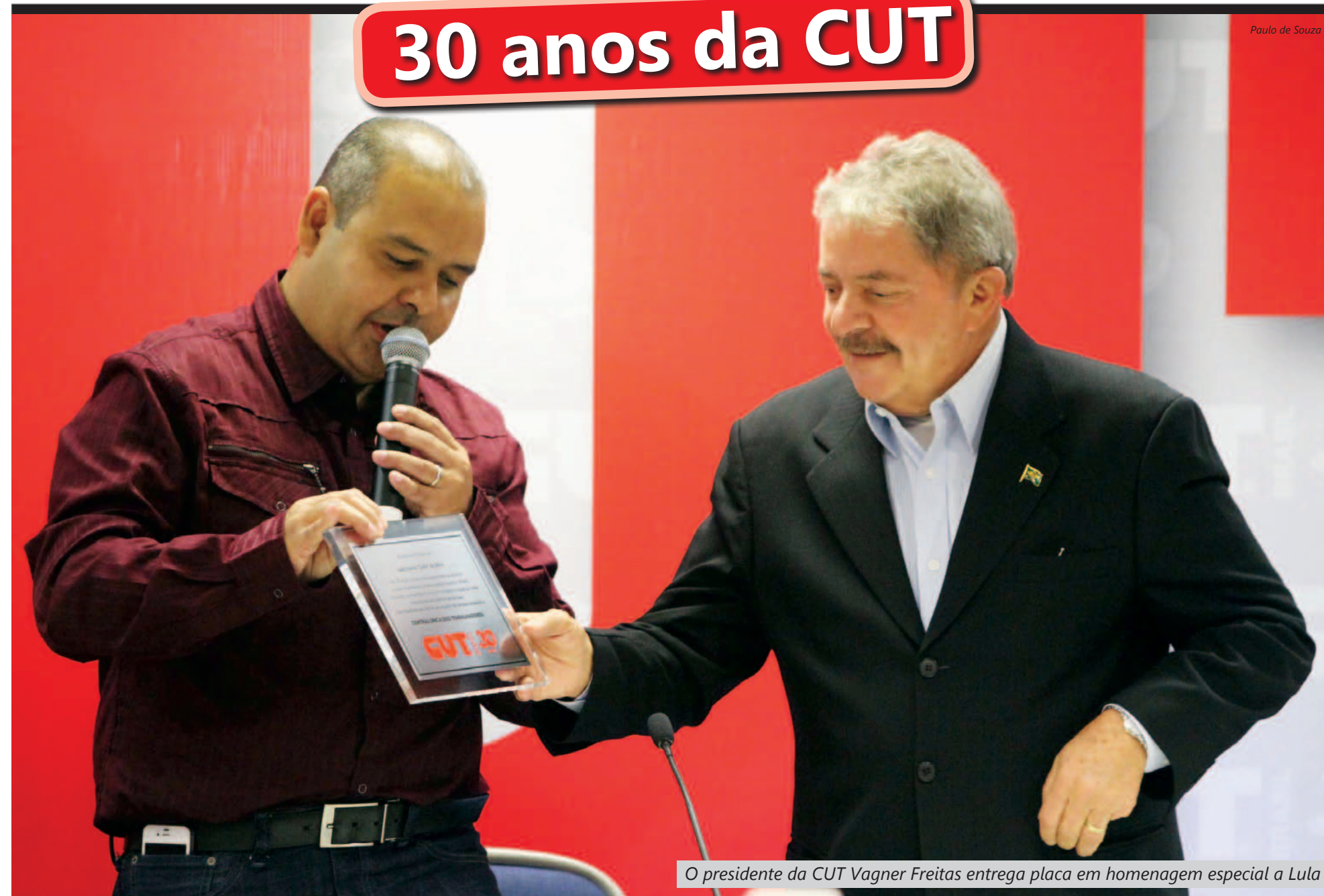
O presidente da CUT Vagner Freitas entrega placa em homenagem especial a Lula