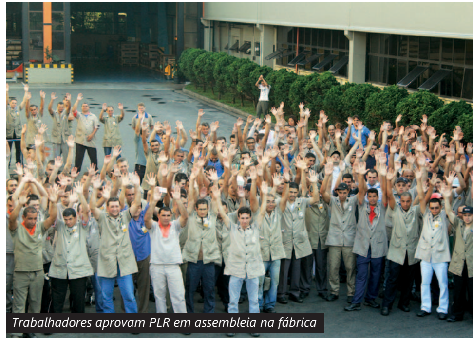
Trabalhadores aprovam PLR em assembleia na fábrica

Este crescimento do consumo, por sua vez, eleva também a produção nas empre-