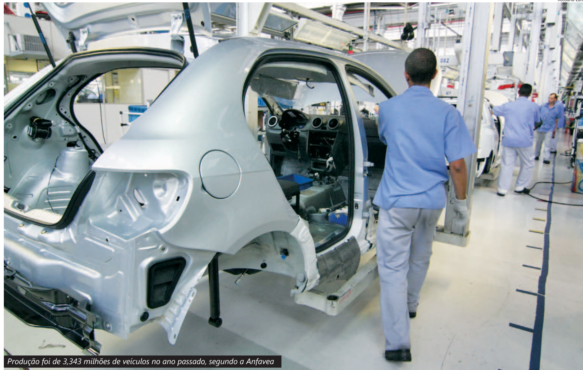
Produção foi de 3,343 milhões de veículos no ano passado, segundo a Anfavea

Impulsionada principalmente pela redução do Imposto sobre Produtos Industrializados (IPI) e pela queda da taxa de juros, a produção de veículos no Brasil bateu novo recorde no ano passado.