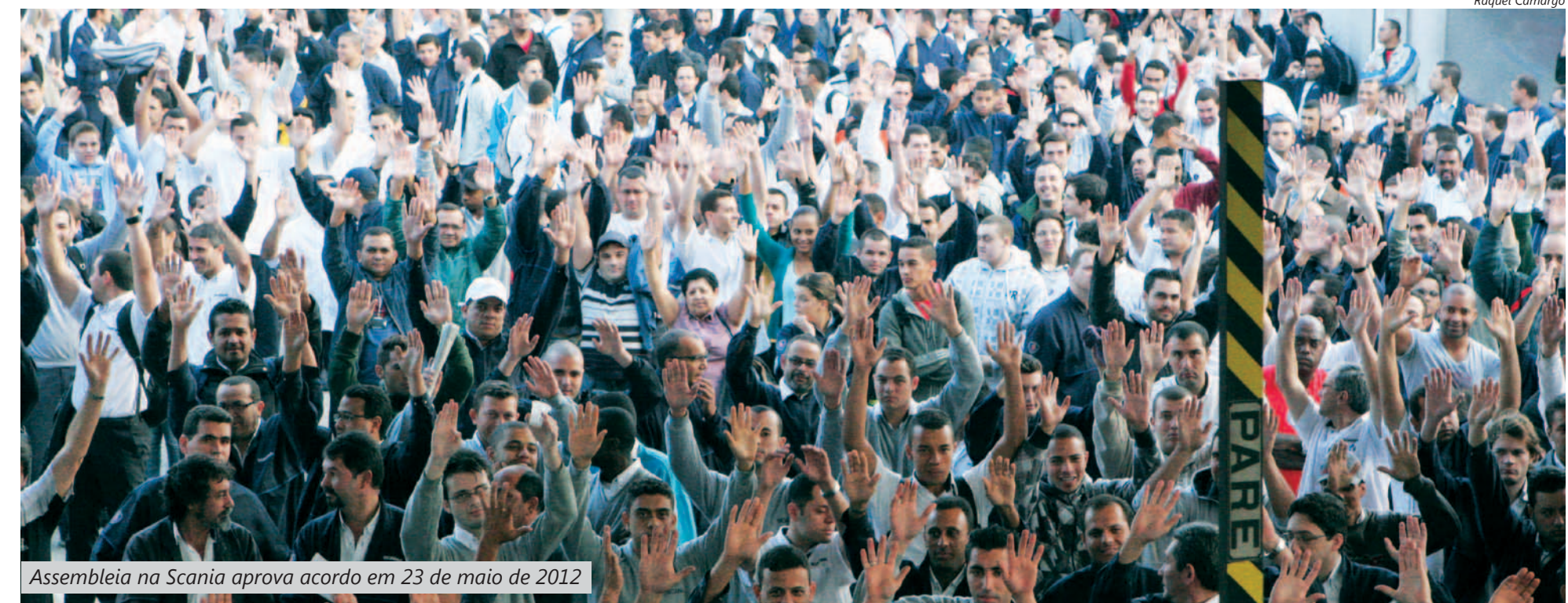
Assembleia na Scania aprova acordo em 23 de maio de 2012

Acordo negociado entre Sindicato e montadora garantiu emprego no passado e aumentou a produção, permitindo a geração de novos postos de trabalho na fábrica de São Bernardo.