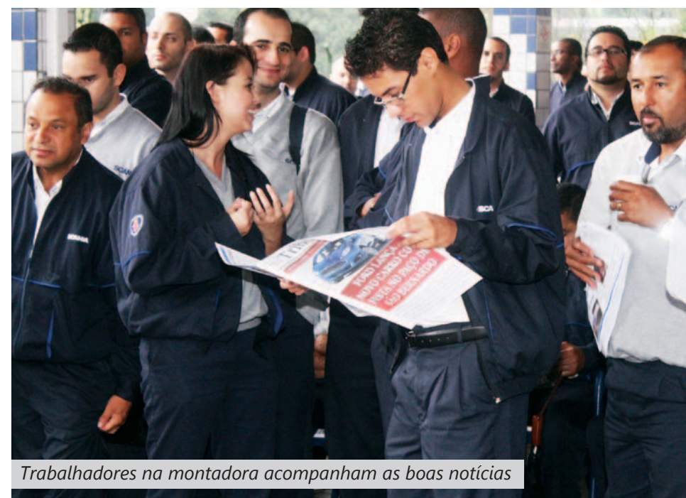
Trabalhadores na montadora acompanham as boas notícias

propostas”, prosseguiu. “Manter uma fábrica forte, como a Scania, espalha bons frutos para outras empresas da base, como, por exemplo, as autopeças, trazendo mais emprego e produção para toda a indústria na região. É isso que queremos”, finalizou o dirigente.