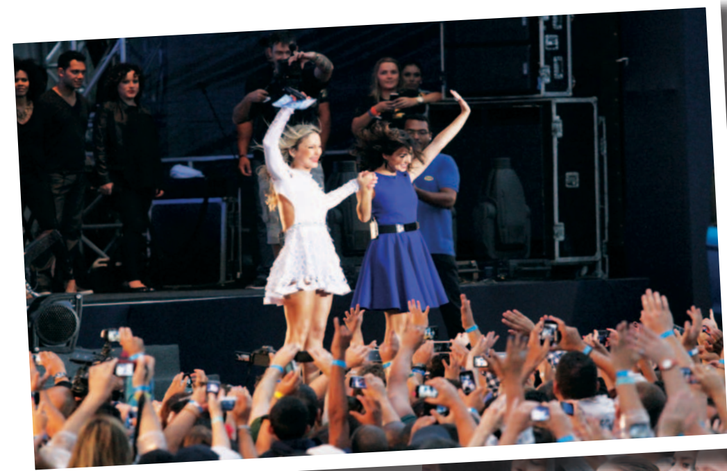
A cantora, Cláudia Leitte e a atriz Ísis Valverde no lançamento do New Fiesta...

de outras entidades representativas dos trabalhadores no Conselho de Competitividade Paulista, lançado na semana passada por Alckmin. Em resposta, o governador garantiu que buscará o apoio de todas as centrais sindicais para o desenvolvimento das câmaras que compõem o Conselho recém-criado.