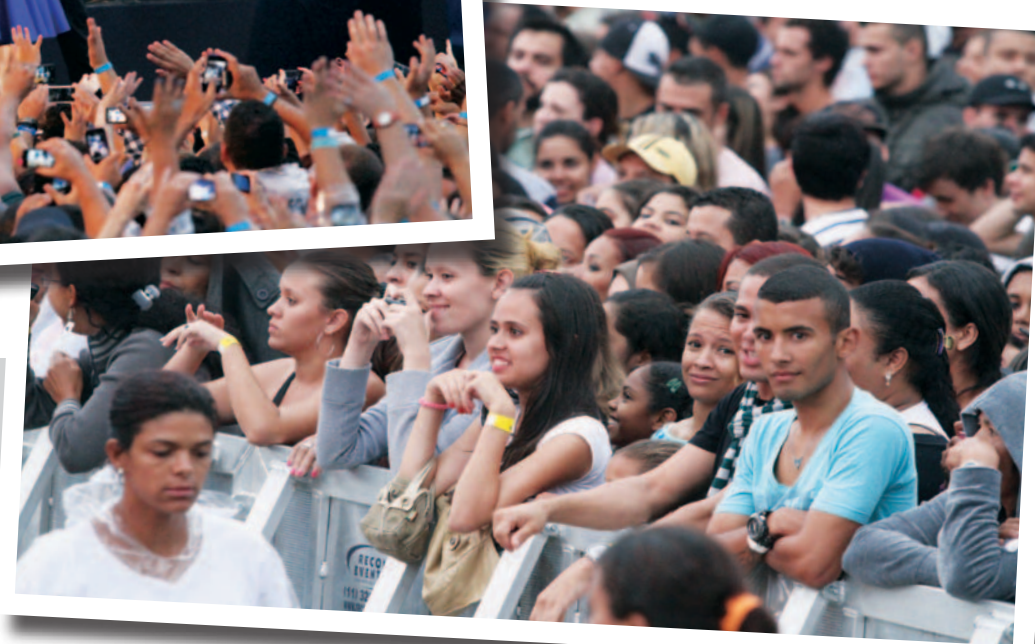
...que atraiu mais de 50 mil pessoas ao Paço de São Bernardo, no último domingo