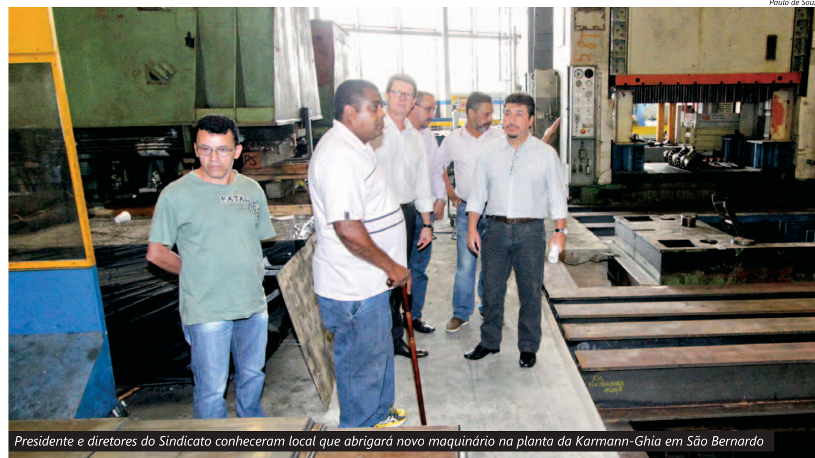
Presidente e diretores do Sindicato conheceram local que abrigará novo maquinário na planta da Karmann-Ghia em São Bernardo

tivos à inovação tecnológica e adensamento da cadeia produtiva do setor automotivo.