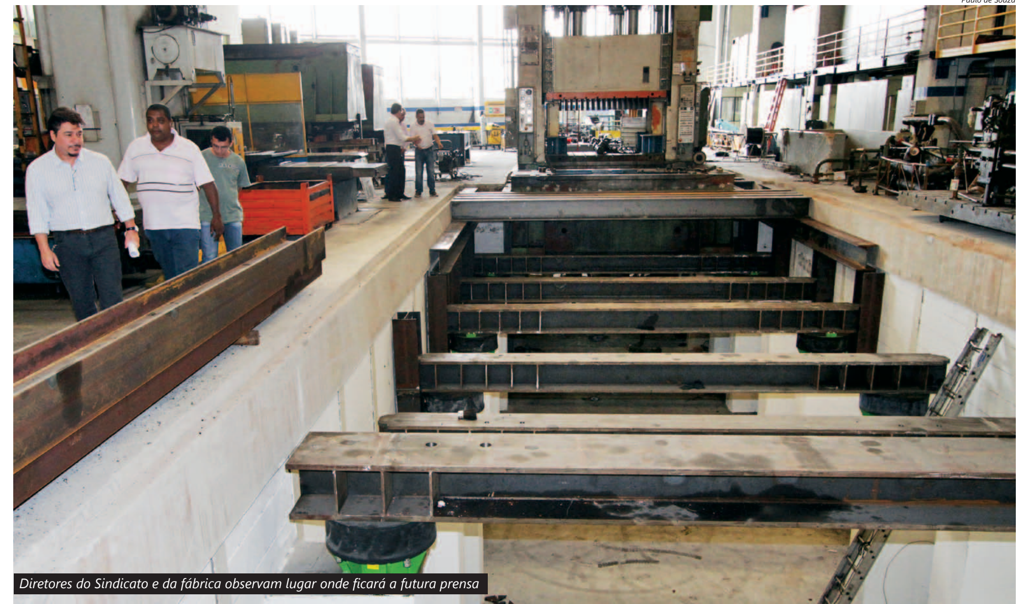
Diretores do Sindicato e da fábrica observam lugar onde ficará a futura prensa

Nova prensa que reduzirá o tempo de troca de ferramenta de 4 horas para 12 minutos é o início do projeto de cinco anos.