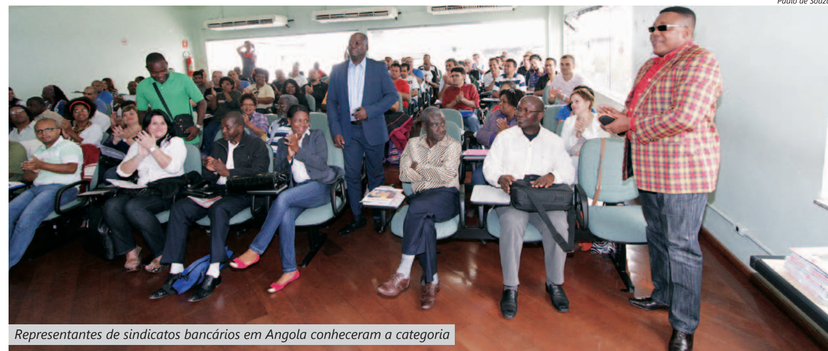
Representantes de sindicatos bancários em Angola conheceram a categoria

"Quem escreveu a realidade africana foi o europeu quando dominou o continente", afirma. "O mito europeu espalhou para o mundo que a África é um continente sem história e sem cultura", finalizou Felipe.