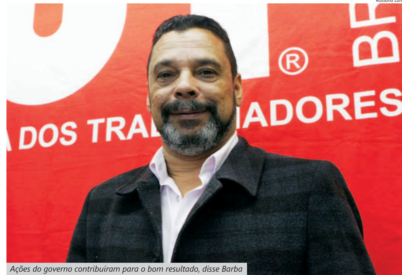
Ações do governo contribuíram para o bom resultado, disse Barba

"Entre essas ações está a mobilização dos