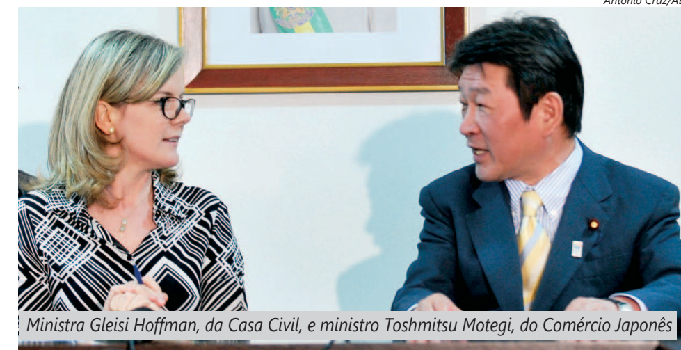
Ministra Gleisi Hoffman, da Casa Civil, e ministro Toshimitsu Motegi, do Comércio Japonês

Mais um resultado positivo do novo Regime Automotivo, o Inovar-Auto, conquistado pelo Sindicato, foi a vinda do ministro de Comércio e Indústria do Japão, Toshimitsu Motegi, ao Brasil.