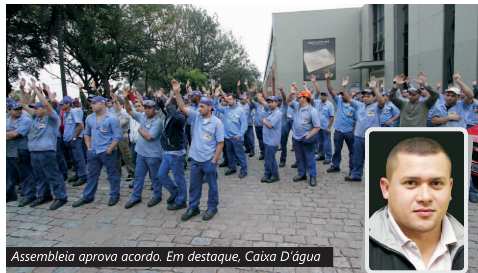
Assembleia aprova acordo. Em destaque, Caixa D'água

Na Rassini, em São Bernardo, o acordo aprovado em assembleia trará um bom reajuste para a companheirada em relação ao aprovado no ano passado.