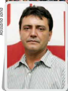
Trabalhadores e empresa terão mais tranquilidade, destacou Colombo

Para chegar até a proposta final, porém, foram necessárias várias reuniões com a montadora. “As reclamações