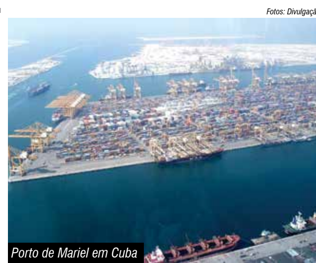
Porto de Mariel em Cuba

dução da presidência da Celac, Dilma disse que seu sentimento é compartilhado por todos que nunca se conformaram em ver Cuba excluída dos foros regionais e multilaterais. Fortes Para a presidenta brasileira, a Celac é um poderoso instrumento de aproximação entre os estados membros. “Nossos países têm aprendido a somar suas diferenças. No fundo, a Celac torna o Caribe mais latino-americano e a América Latina mais caribenha”, comparou. A presidenta destacou ainda que o objetivo da cúpula não é eliminar os acordos paralelos à organização. “A Celac não impede as relações bilaterais entre os Estados, dentro e fora da região. Pelo contrário, tem a capacidade de fortalecê-las”.