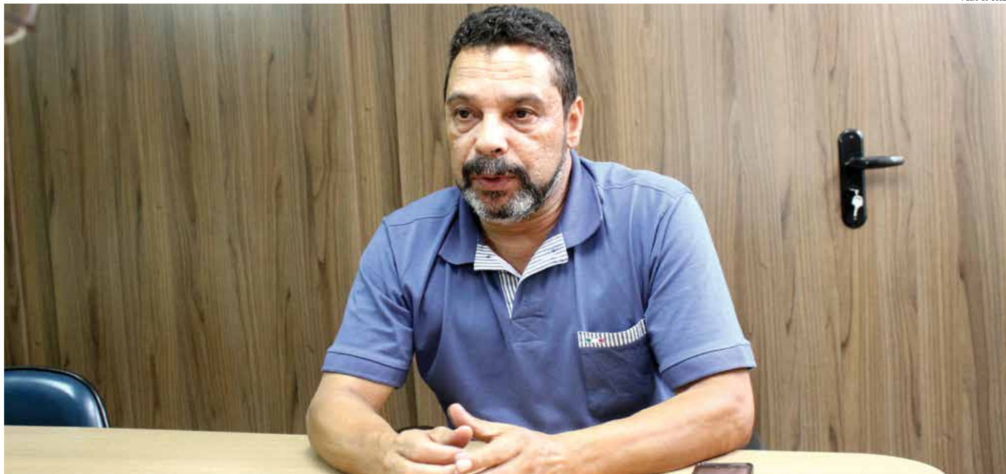
Remessa de Lucros X Investimento