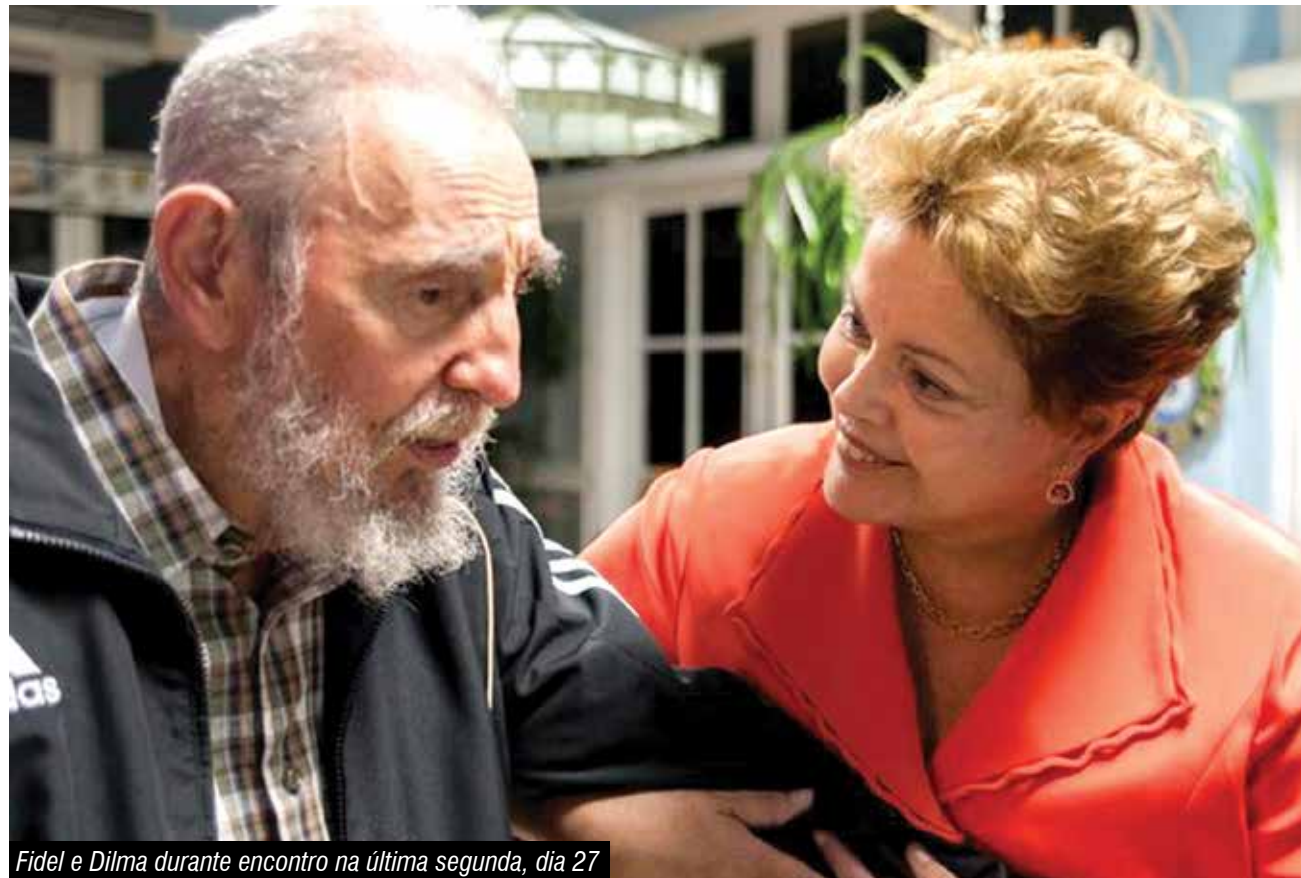
Fidel e Dilma durante encontro na última segunda, dia 27

Durante discurso na 2ª Cúpula da Comunidade dos Estados Latino-Americanos e Caribenhos (Celac), a presidenta Dilma Rousseff voltou a condenar na terça-feira (28) as políticas de sanção impostas a Cuba pelos Estados Unidos desde 1962. Segundo ela, é imprescindível a participação do país caribenho nos acordos econômicos da região. “Temos a convicção de que não haverá verdadeira integração econômica na América Latina e no Caribe sem Cuba”, declarou. O evento ocorre em Havana, capital cubana, e desde sua chegada a presidenta se encontrou com os líderes de Cuba, Raúl e Fidel Castro, e da Argentina, Cristina Kirchner. Ao reconhecer o êxito de Cuba na con-