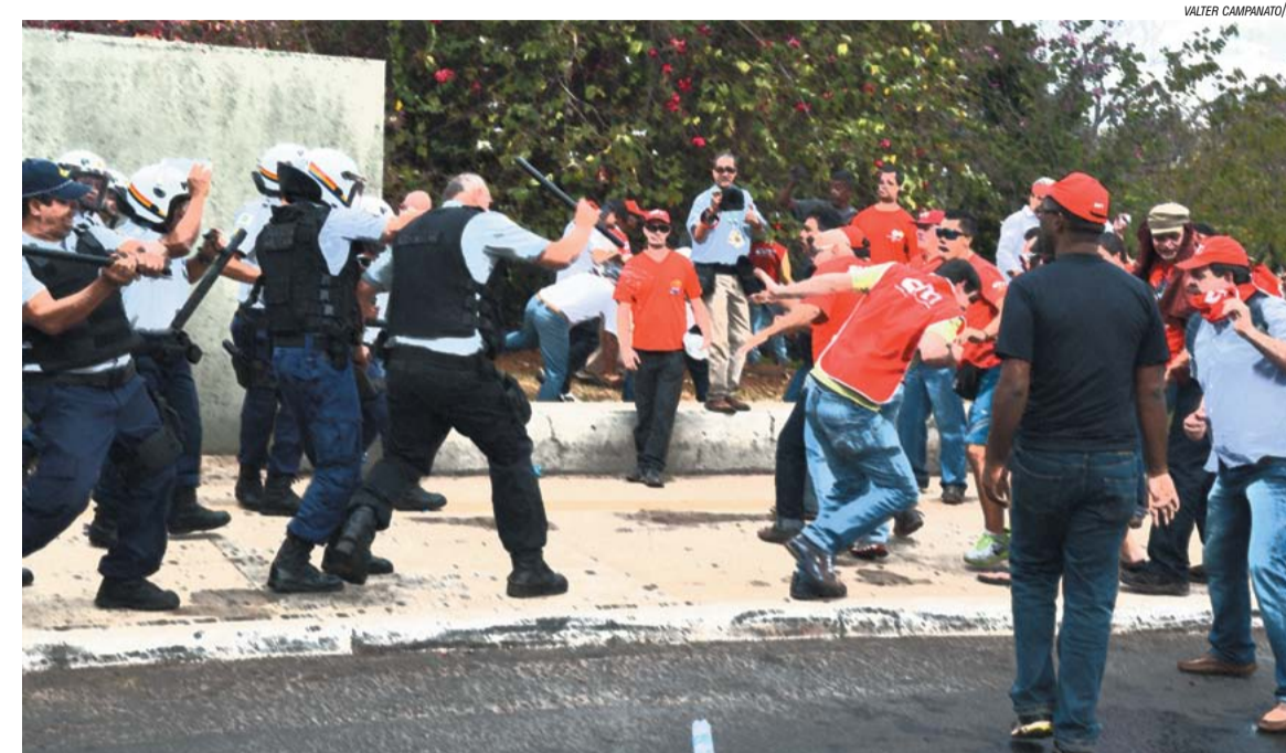
Policia reprime ato da CUT em Brasília durante votação do Projeto de Lei da Precarização, em 2013

Além disso, a Associação Brasileira do Agronegócio pede a suspensão do andamento de qualquer processo em curso na Justiça do Trabalho em que se discuta a legalidade da