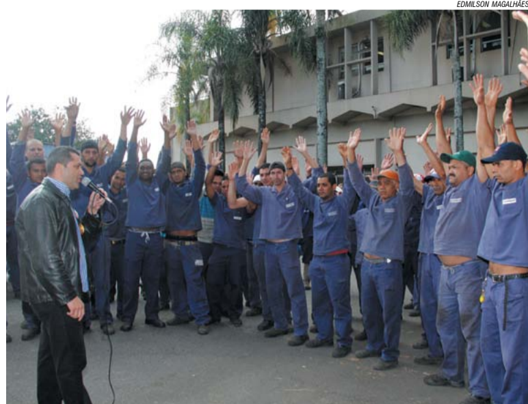
Assembleia na Conipost aprova atuação da FEM nas negociações

Trabalhadores na Resil e na Conipost, em Diadema, aprovaram em assembleias ontem pela manhã continuar a mobilização para fortalecer o Sindicato nas duas negociações de hoje na Campanha Salarial.