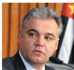
SAMUEL MOREIRA PSDB-SP