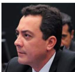
ELI CORRÊA FILHO DEM-SP