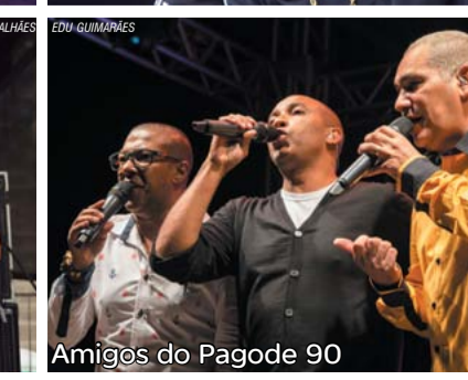
Amigos do Pagode 90