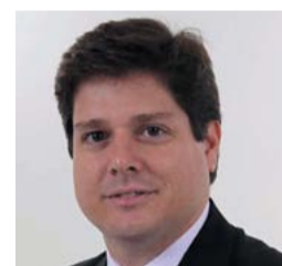
BALEIA ROSSI PMDB-SP