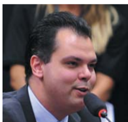
BRUNO COVAS PSDB-SP