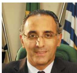
EDUARDO CURY PSDB-SP