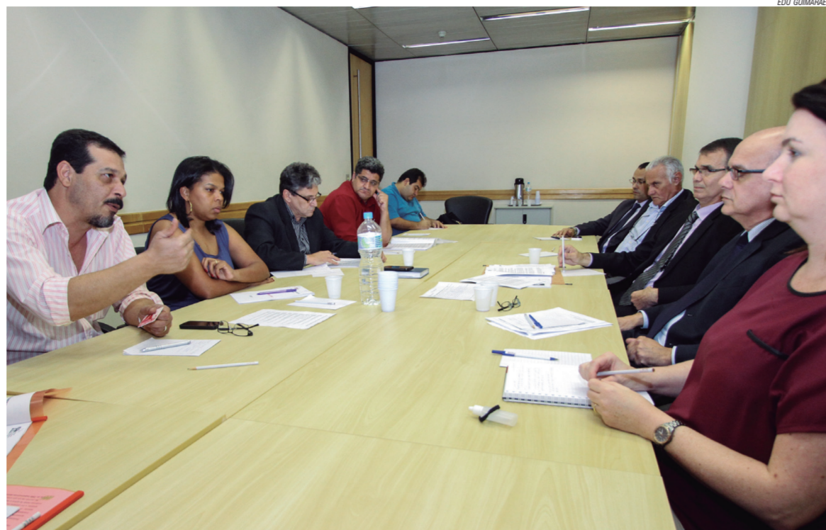
Negociação com a bancada patronal do Grupo 10

A bancada patronal disse que avaliará as reivindicações da FEM e que dará uma resposta na próxima rodada, que ainda será agendada.