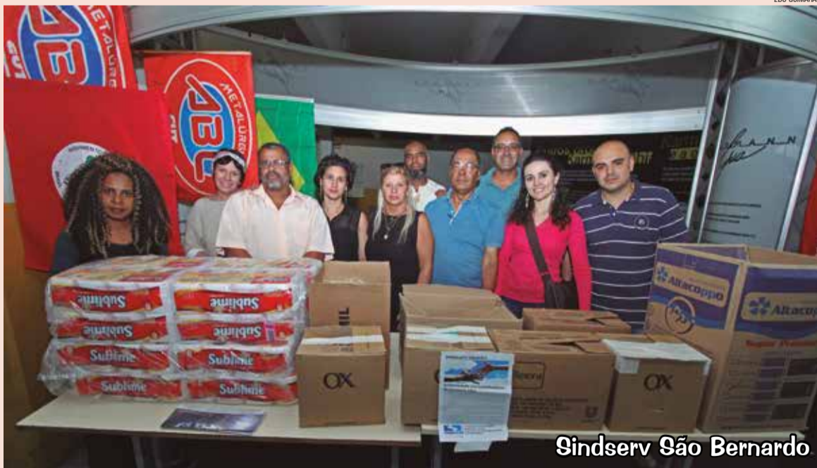
Sindserv São Bernardo

Na última quinta-feira, dia 14, os trabalhadores receberam doações de produtos de higiene dos representantes do Sindicato dos Servidores Públicos de São Bernardo. Na semana anterior, os diretores do SindSaúde ABC visitaram a ocupação.