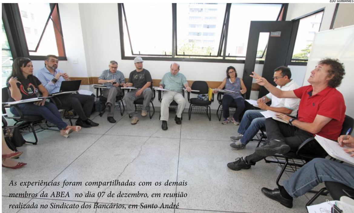
As experiências foram compartilhadas com os demais membros da ABEA no dia 07 de dezembro, em reunião realizada no Sindicato dos Bancários, em Santo André

Divididos em grupos , os representantes visitaram entidades e empresas que empregam trabalhadores com deficiência, com destaque para intelectual. “Muitas experiências que conhecemos lá fora são possíveis