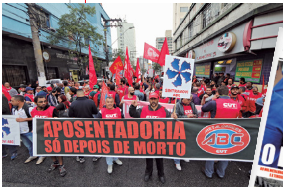
26/4/17 Caminhada em Santo André