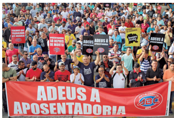
15/3/17 – Paralisação integral na Volks, em São Bernardo