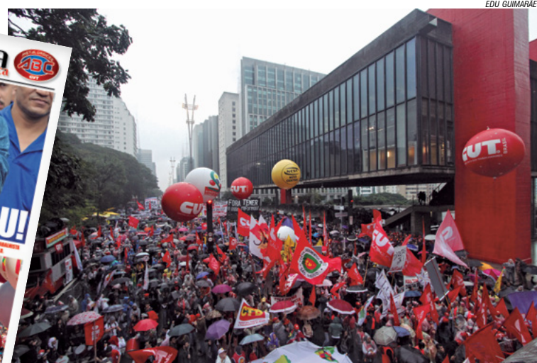
21/5/17 – Manifestação pelas 'Diretas Já' e 'Fora, Temer', na Avenida Paulista, em São Paulo