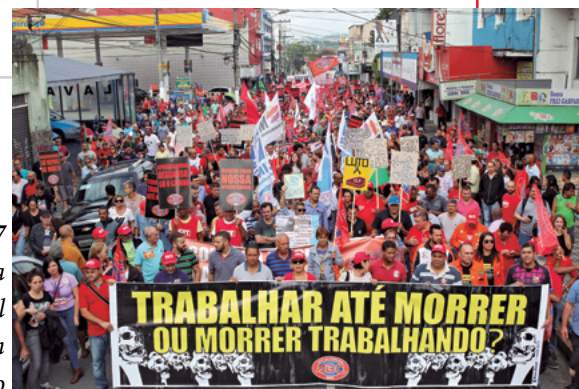
8/4/17 Passeata pela rua Marechal Deodoro, em São Bernardo