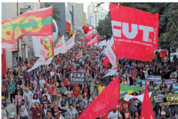
31/3/17 Ato dos trabalhadores e estudantes na Av. Paulista, em São Paulo