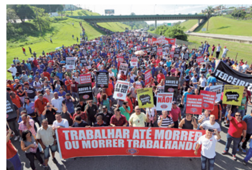
7/3/17 – Ato na Imigrantes, em Diadema

Desde a apresentação da proposta da reforma da Previdência, anunciada em dezembro passado, os Metalúrgicos do ABC estão nas ruas marcando posição contra a medida. A luta se somou ao combate à reforma Trabalhista, apresentada em janeiro e a Lei de Terceirização, sancionada em março.