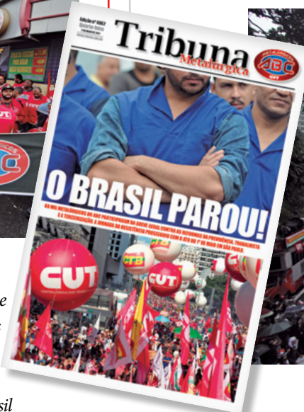
28/4/17 – Greve Geral junto aos 40 milhões de trabalhadores em todo o Brasil